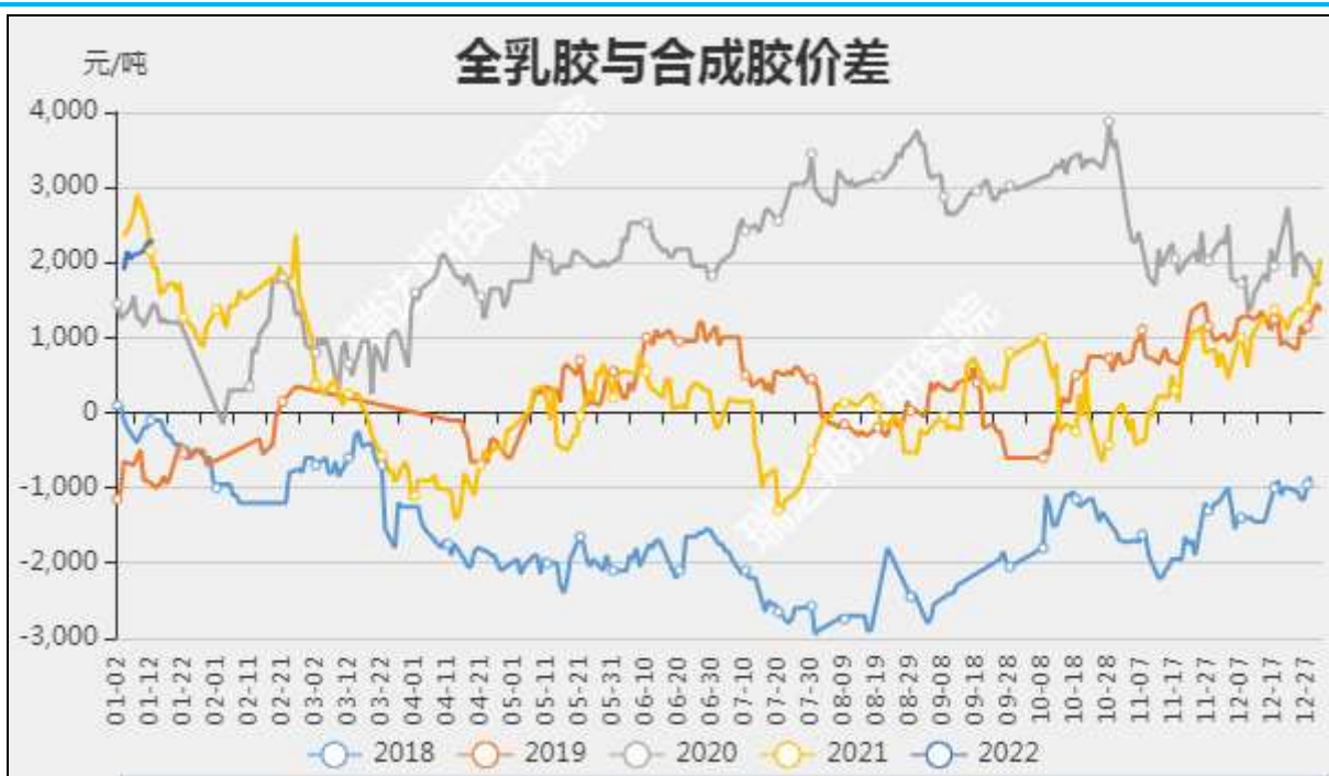
图9 全乳胶与合成胶价差

截至1月20日, 华北市场丁苯橡胶12300元/吨, 较上周+500元/吨; 华北市场顺丁橡胶报13320元/吨, 较上周+0元/吨。