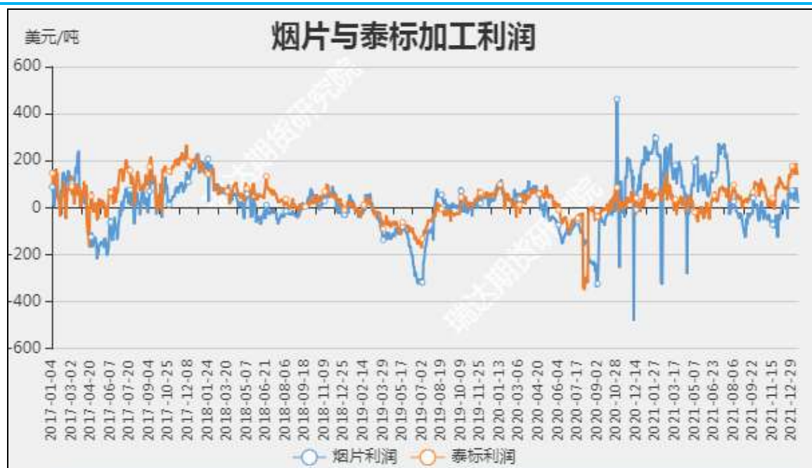
图12 标胶和烟片加工利润