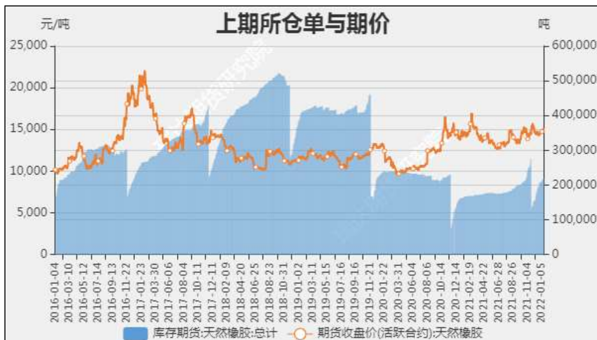
图10 沪胶期价与仓单走势对比