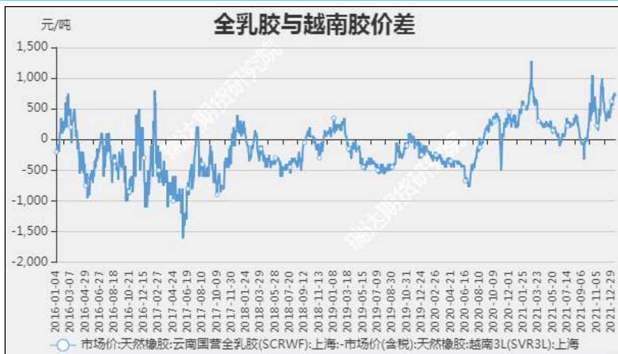
图6 全乳胶与越南3L价差