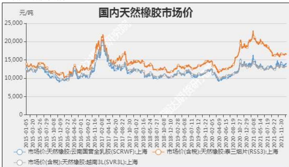
图2 国内天然橡胶市场价