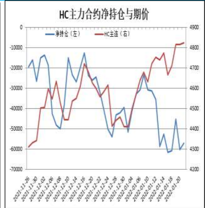
图12：热卷主力合约前20名净持仓

HC2205合约前20名净持仓情况，14日为净空52804手，21日为净空57044手，净空增加4240手，由于空单增幅大于多单。