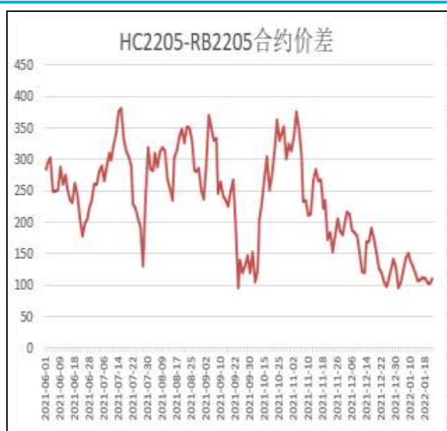
图6：热卷与螺纹跨品种套利

本周，HC2205合约走势强于RB2205合约，21日价差为111元/吨，周环比+3元/吨。