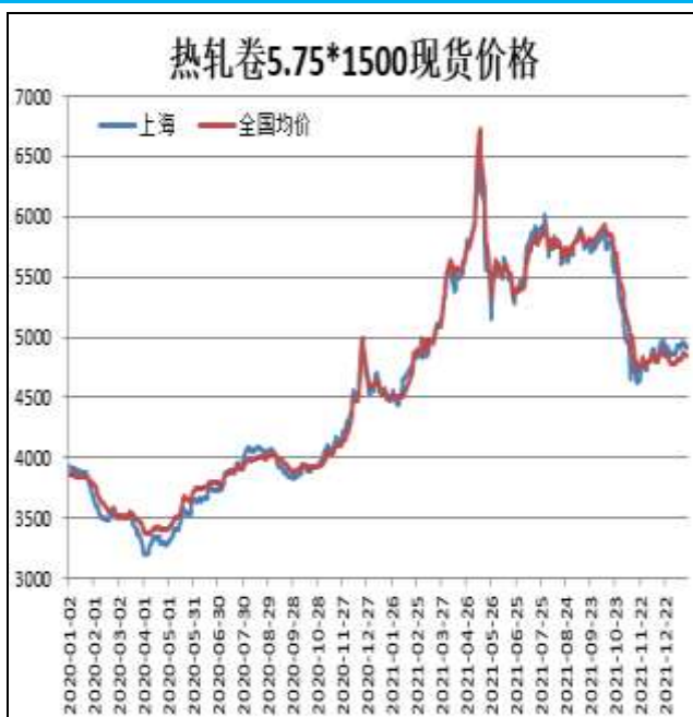
图1：热轧卷板现货价

1月21日，上海热轧卷板5.75mm Q235现货报价为4950元/吨，周环比+10元/吨；全国均价为4893元/吨，周环比+29元/吨。