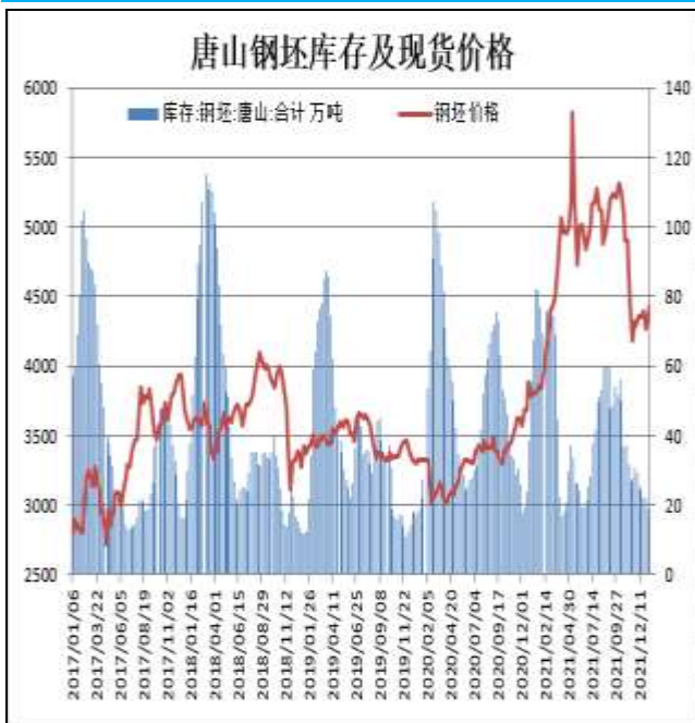
图11：唐山钢坯库存量

1月20日，唐山钢坯库存量为15.24万吨，较上周增加0.57万吨，钢坯现货报价4440万吨。