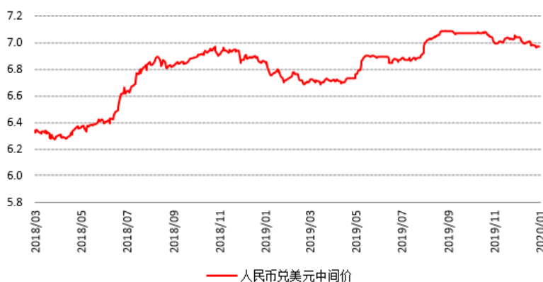
人民币兑美元中间价

周一(2月3日)美元指数涨0.47%报97.8201, 因制造业PMI大幅反弹至荣枯线上方, 停止了持续数月的萎缩。欧元兑美元跌0.29%报1.1059, 英镑兑美元跌1.49%报1.2997, 澳元兑美元涨0.05%报0.6692, 美元兑日元涨