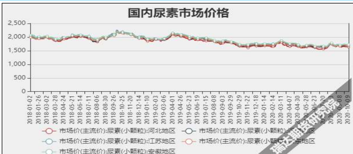
图3 国内尿素市场主流价

截至10月15日，NYMEX天然气收盘价2.78美元/百万英热单位，较上周+0.15美元/百万英热单位。