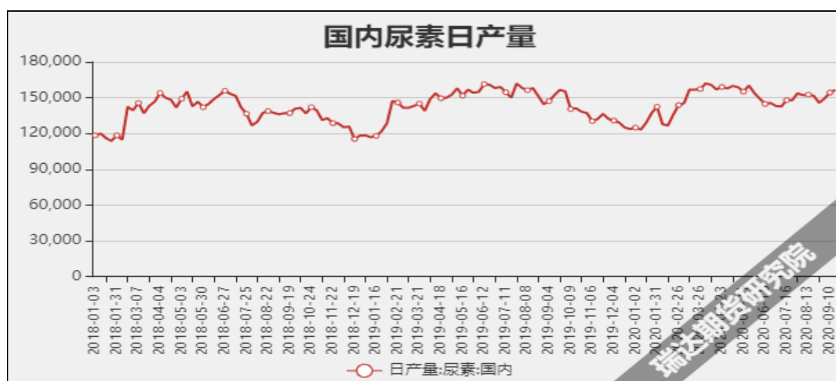
图7 国内尿素日产量