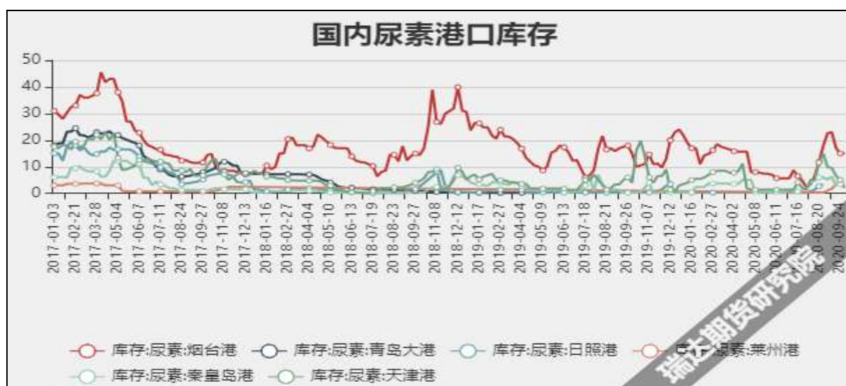
图9 国内尿素港口库存