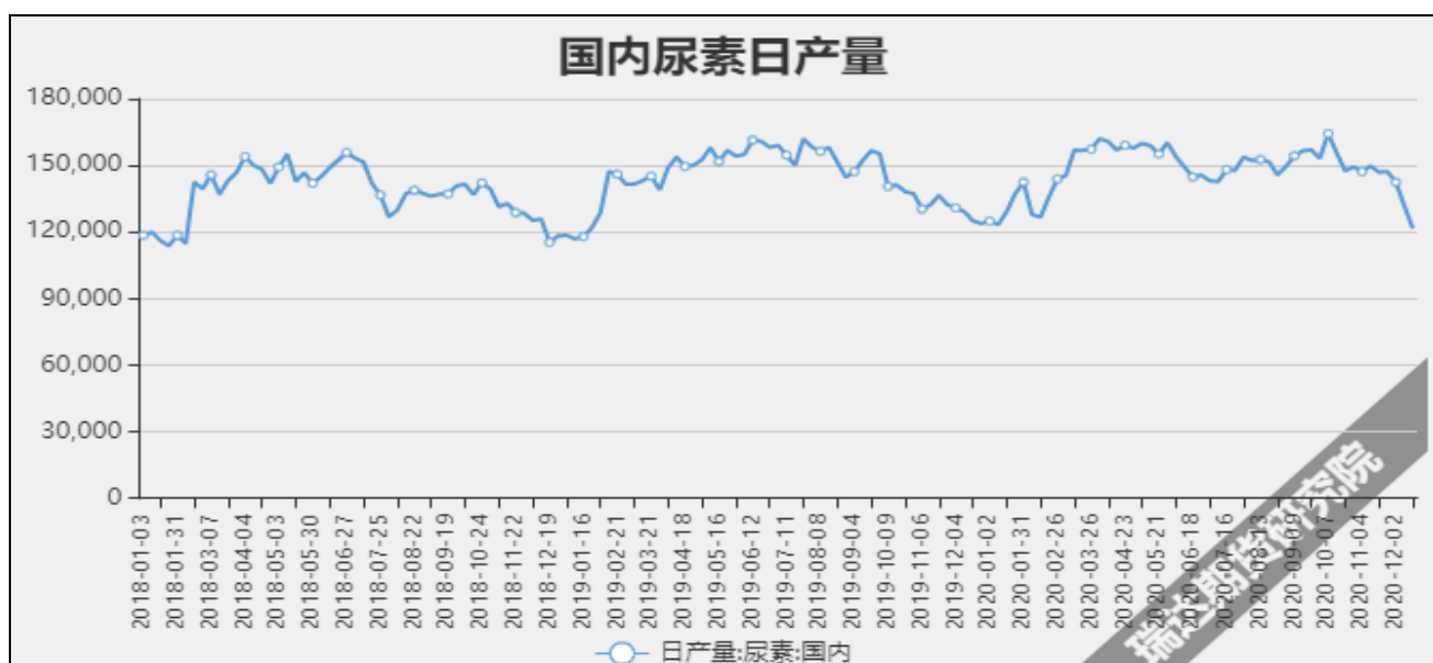
图7 国内尿素日产量