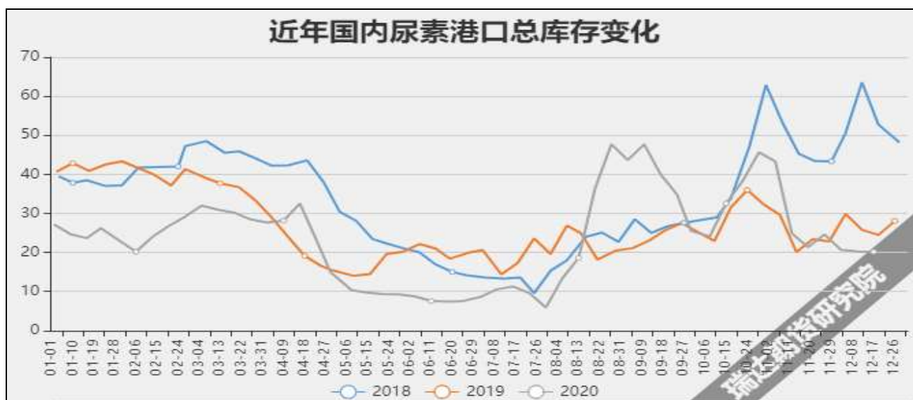
图9 国内尿素港口库存