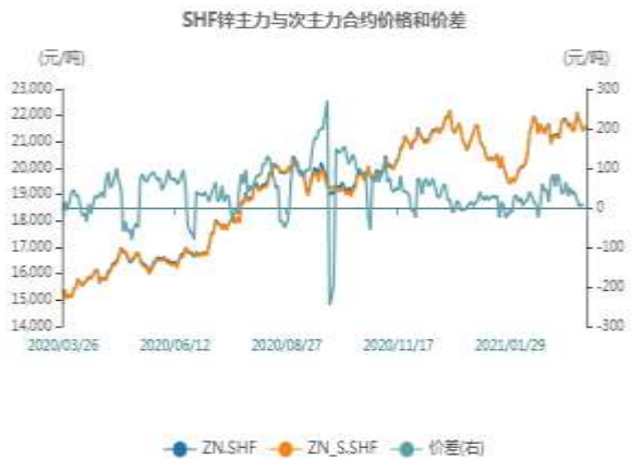
图5：沪锌主力与次主力价差走势图