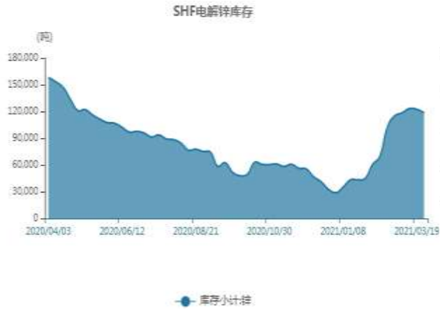
图11：上海锌库存走势图

截止至2021年4月2日，上海期货交易所精炼锌库存为113125吨，较上一周减5341吨。