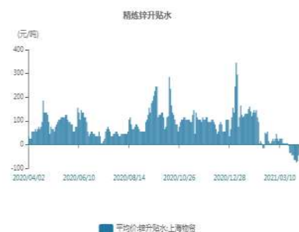
图9：上海精炼锌贴水走势图