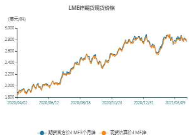
图8、LME锌现货价格走势

截止至2021年4月1日，LME3个月锌期货价格为2769美元/吨，LME锌现货结算价为2765.5美元/吨。