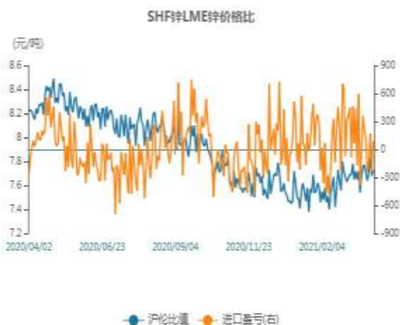
图1：锌两市比值走势图