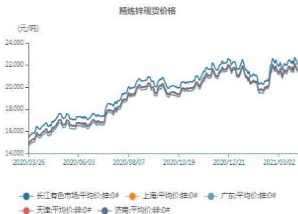
图7、国内精炼锌价格走势

截止至2021年4月2日，长江有色市场0#锌平均价21850元/吨；上海、广东、天津、济南四地现货价格分别为21550、21390、21500、21550元/吨。