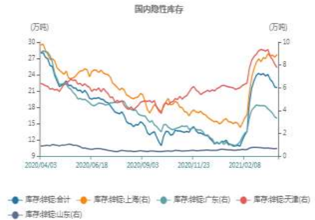
图14：国内隐性库存走势图