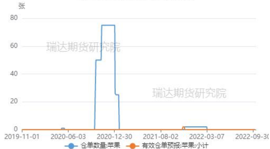
郑商所苹果仓单及有效预报