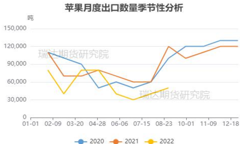
图、苹果出口量季节性情况