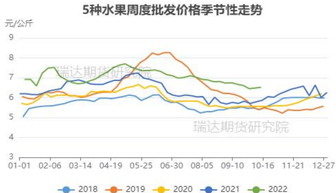
图、5种水果批发价格走势（富士、香蕉、葡萄、鸭梨和西瓜）