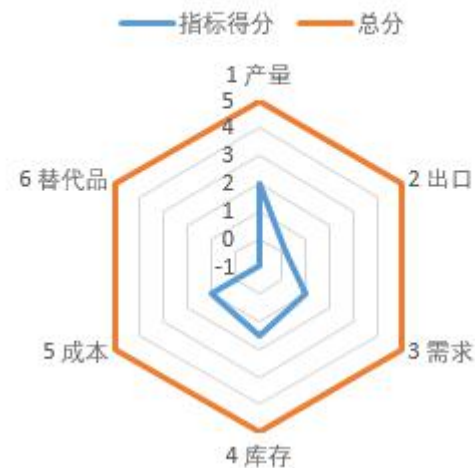
苹果影响因素分析