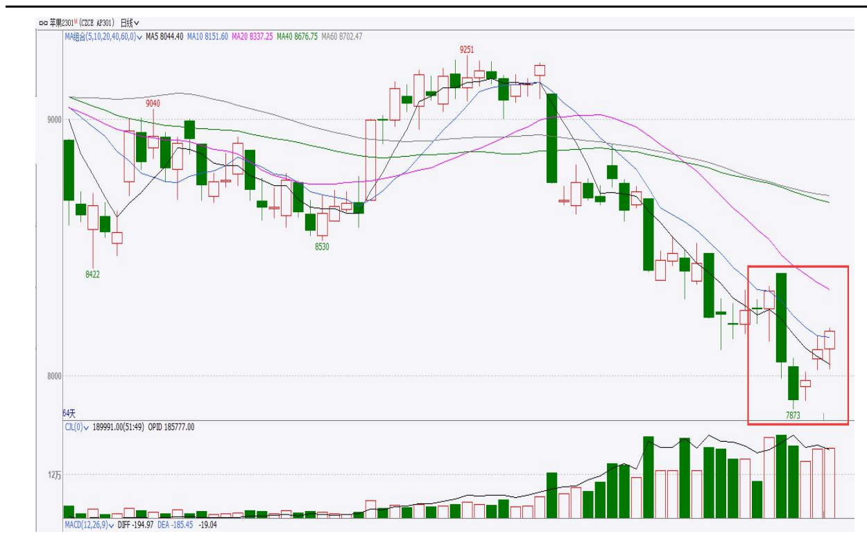
图、苹果主力2301合约价格走势