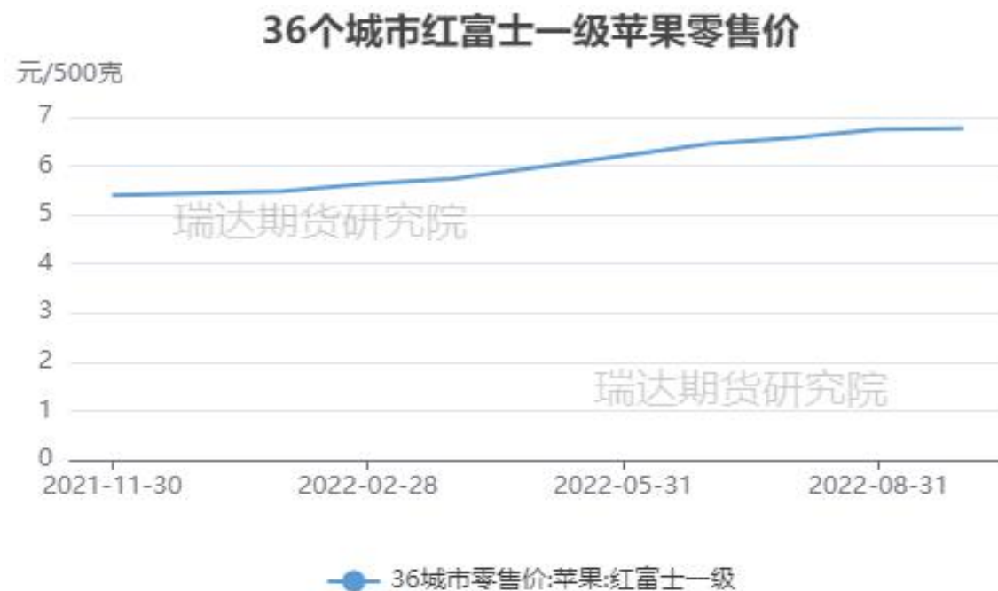
图、36个城市富士苹果零售价格走势