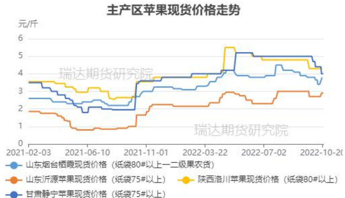
图、主产区苹果现货价格走势