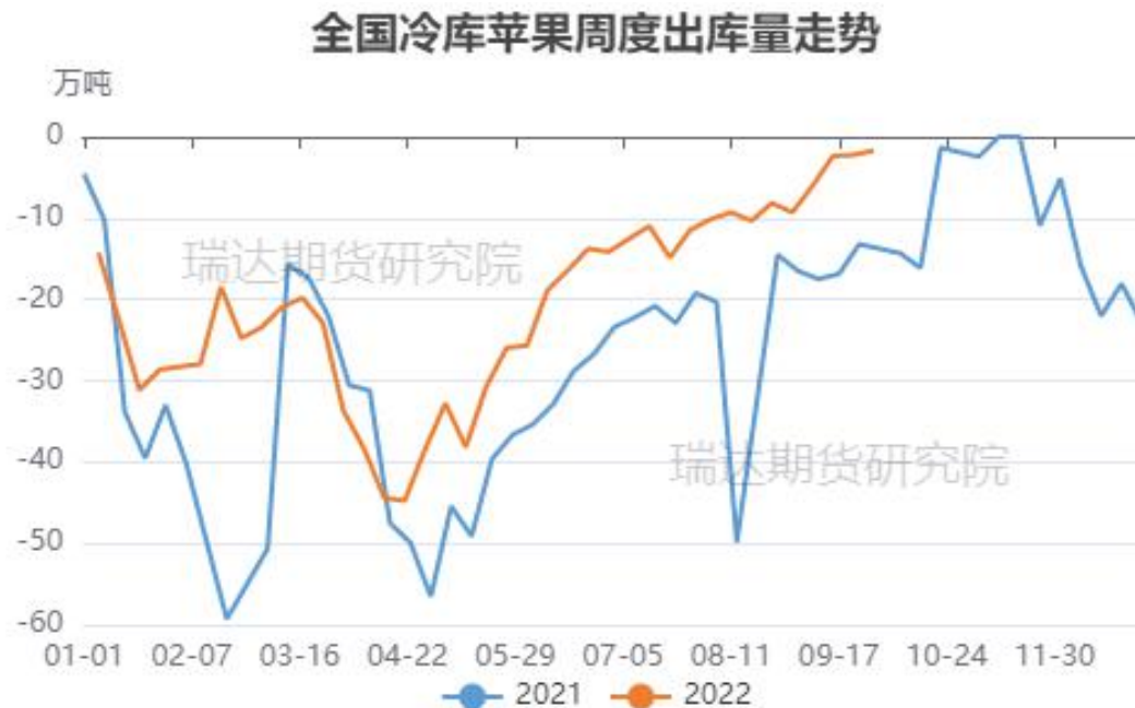
图、全国苹果冷库去库量走势