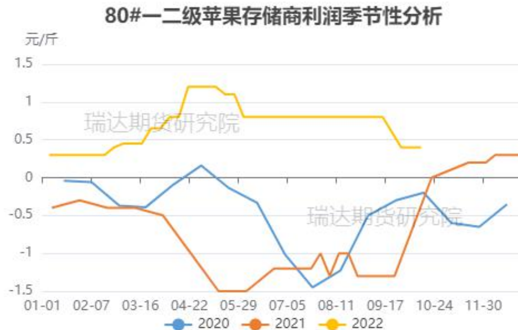
图、80#一二级富士存储商利润走势