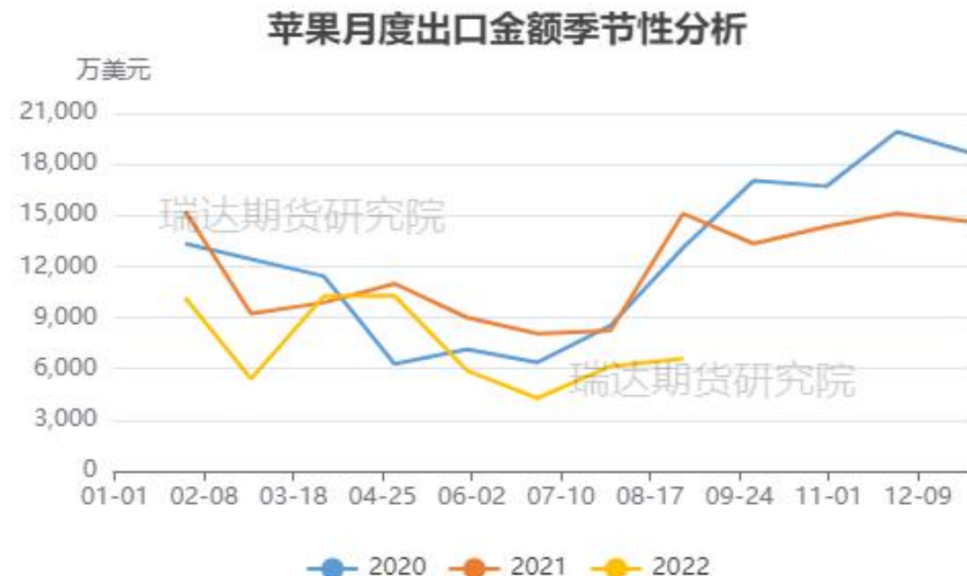
图、苹果出口金额季节性走势