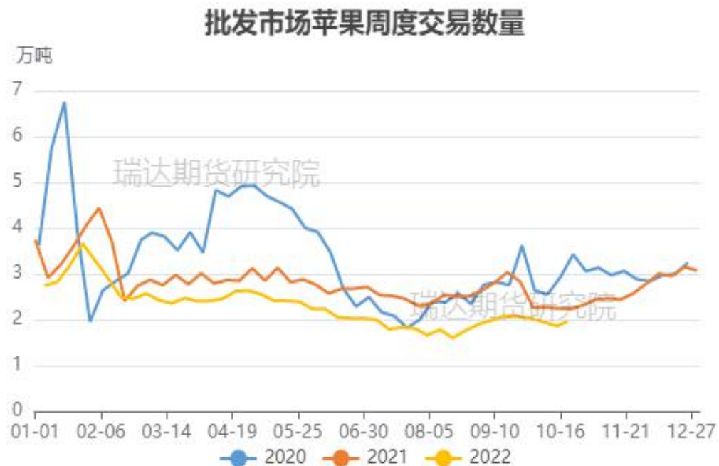
图、苹果批发市场走货情况