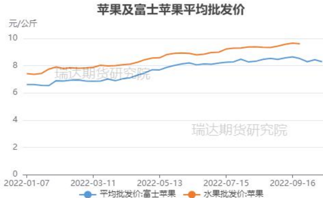
图、全品种苹果及富士苹果批发价格