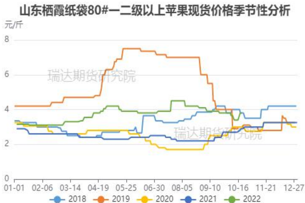
图、山东栖霞80#一二级苹果现货价格季节性走势