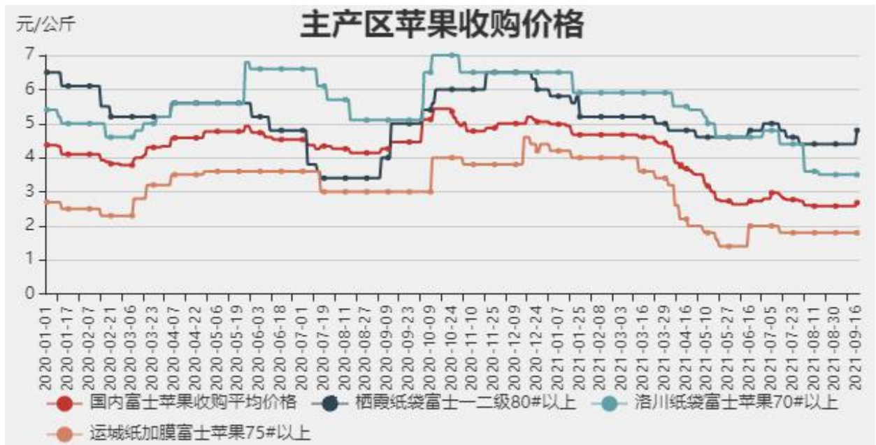
图4：主产区苹果收购价格