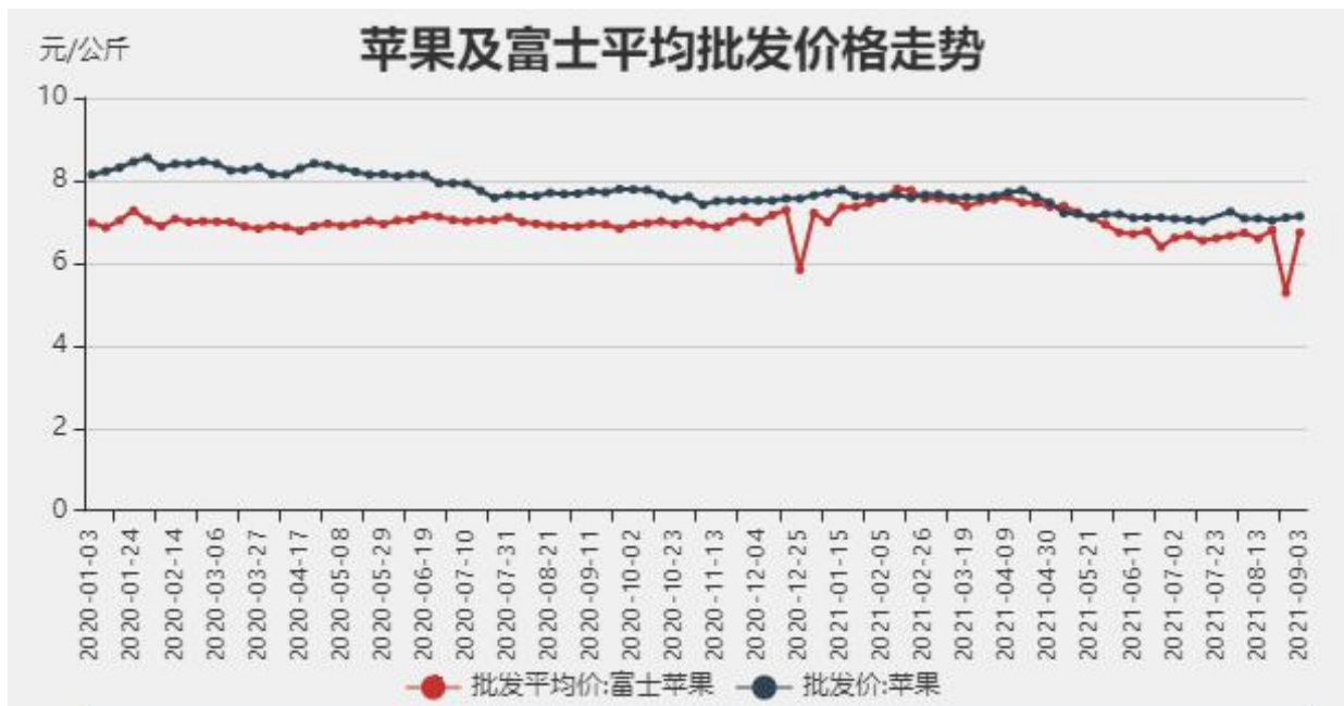
图3：苹果批发价格走势