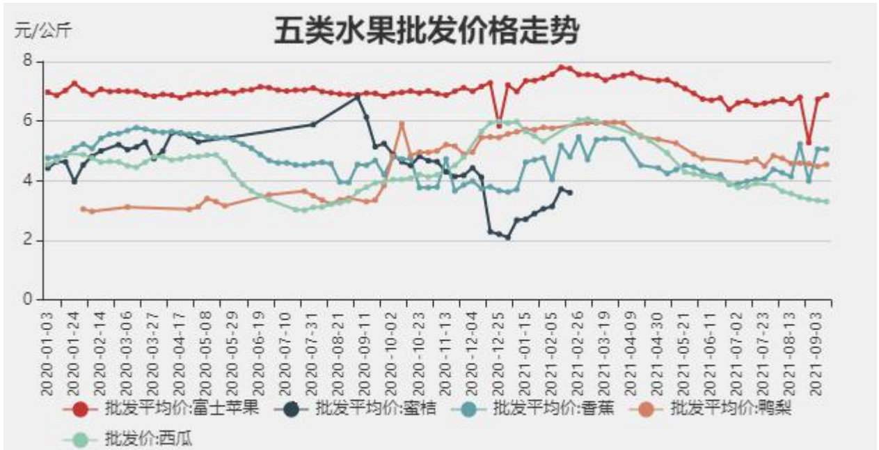
图6：五类水果批发价格走势情况