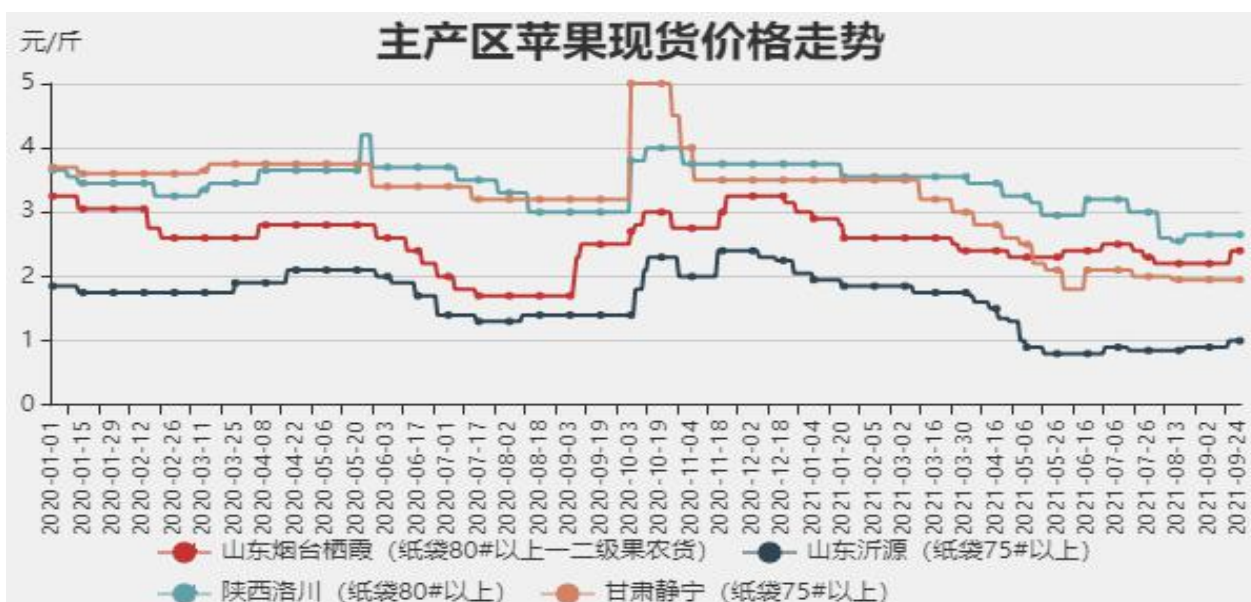
图1：富士苹果主产区现货价格走势