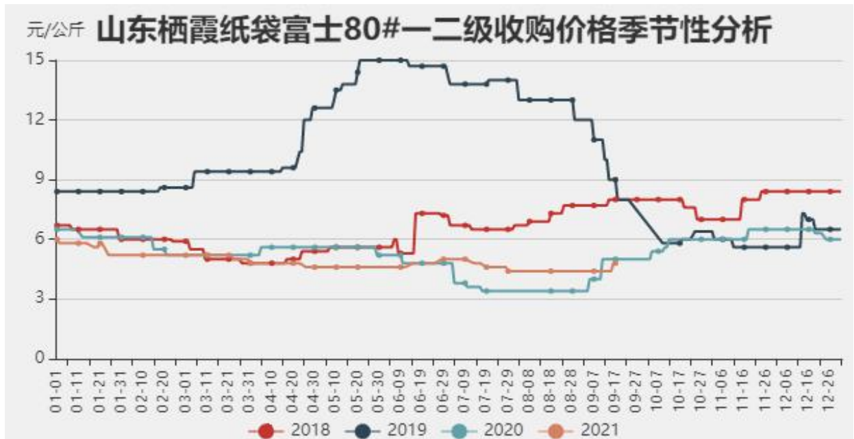
图5：山东栖霞纸袋80#一二级以上苹果收购价格