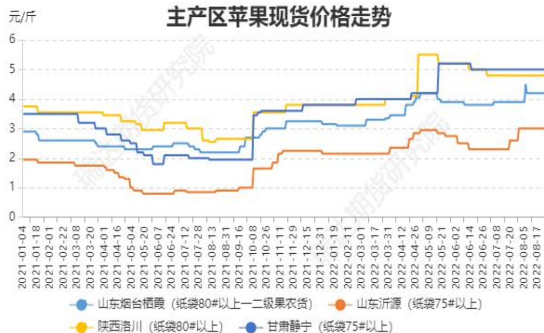
图、主产区苹果现货价格走势