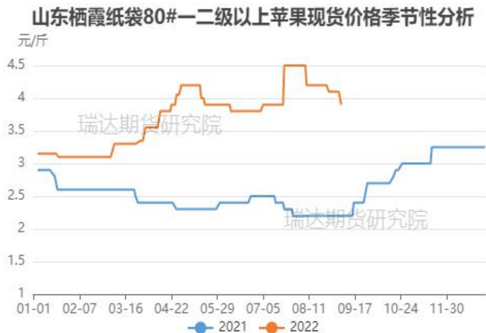
图、山东栖霞80#一二级苹果现货价格季节性走势