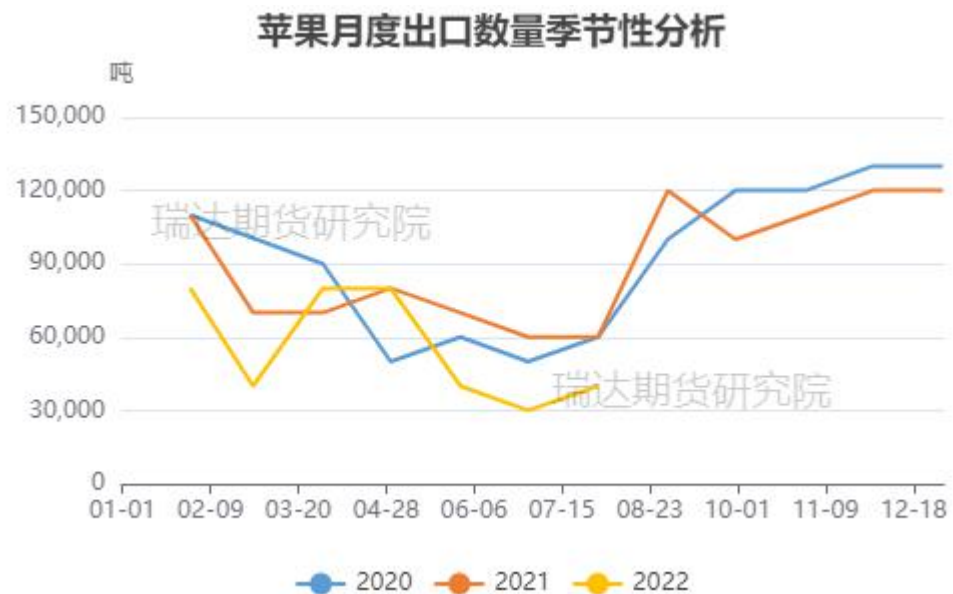
图、苹果出口量季节性情况