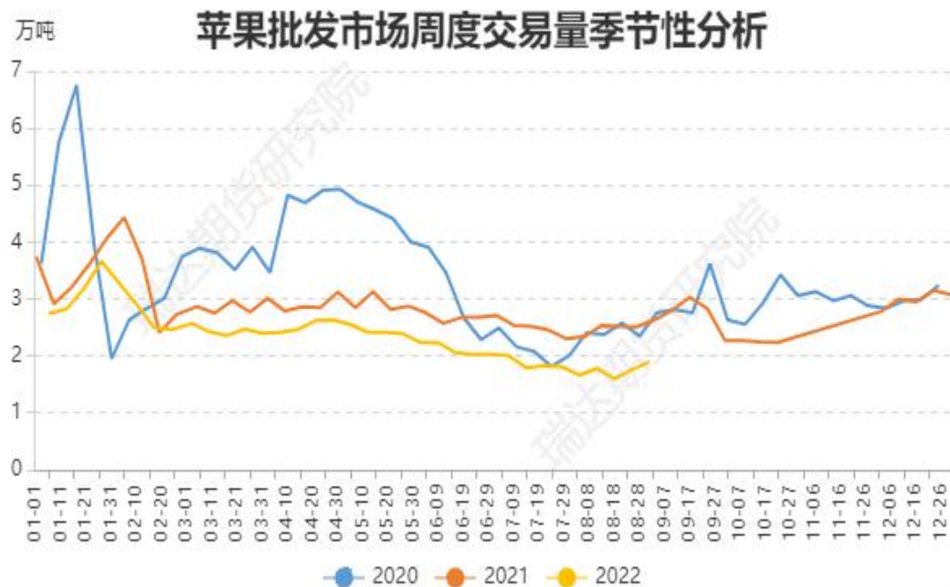
图、苹果批发市场走货情况