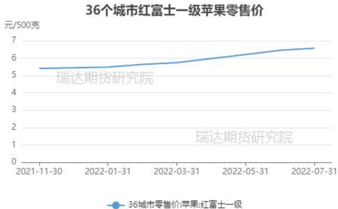
图、36个城市富士苹果零售价格走势