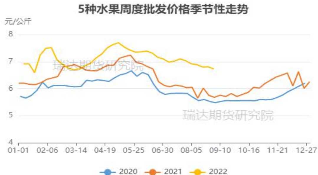
图、5种水果批发价格走势（富士、香蕉、葡萄、鸭梨和西瓜）