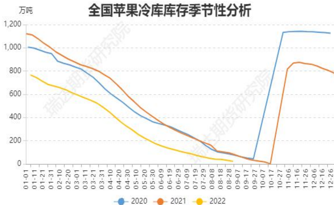
图、全国苹果冷库库存季节性分析