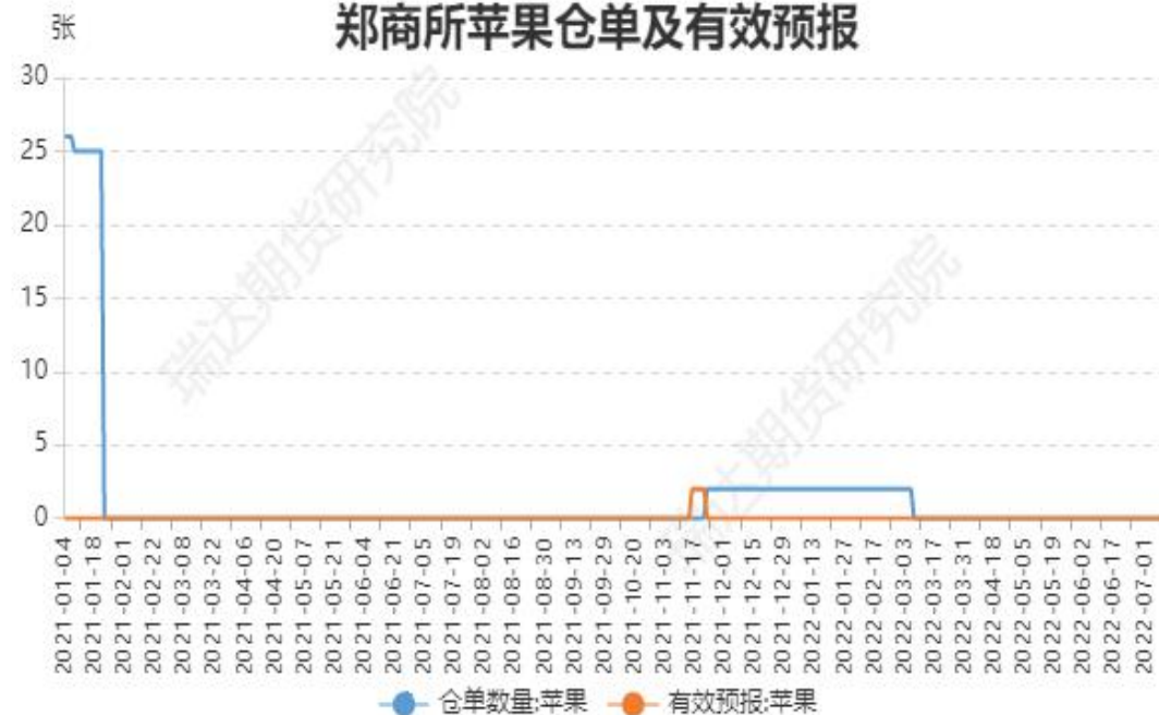
郑商所苹果仓单及有效预报