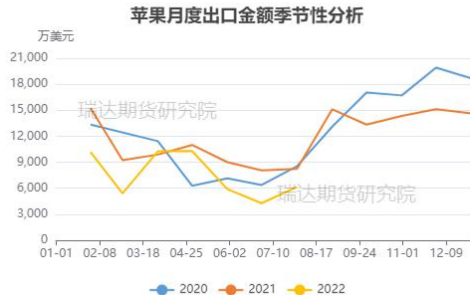
图、苹果出口金额季节性走势