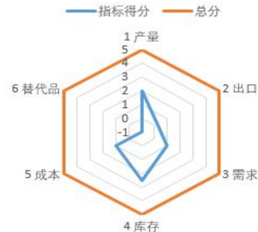
苹果影响因素分析