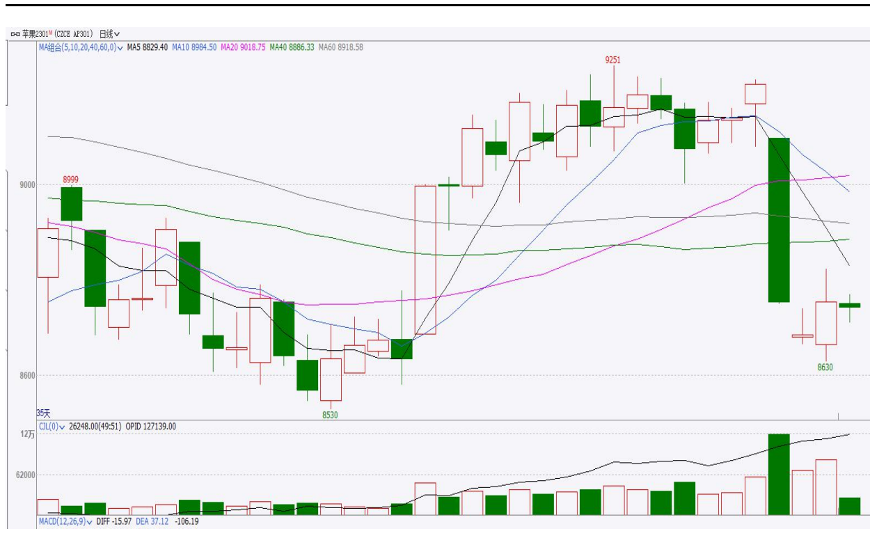
图、苹果主力2301合约价格走势