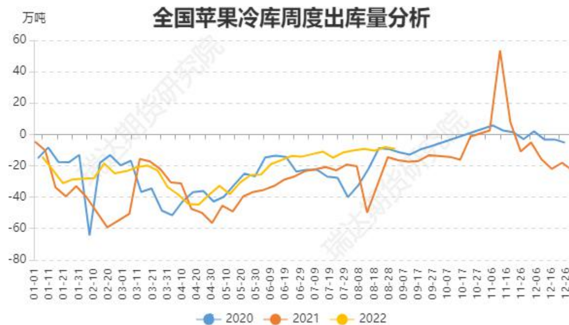
图、全国苹果冷库去库量走势