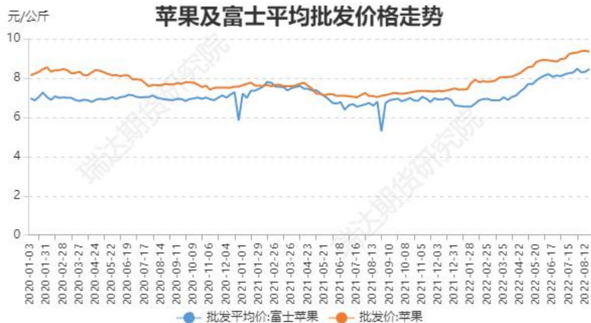
图、全品种苹果及富士苹果批发价格