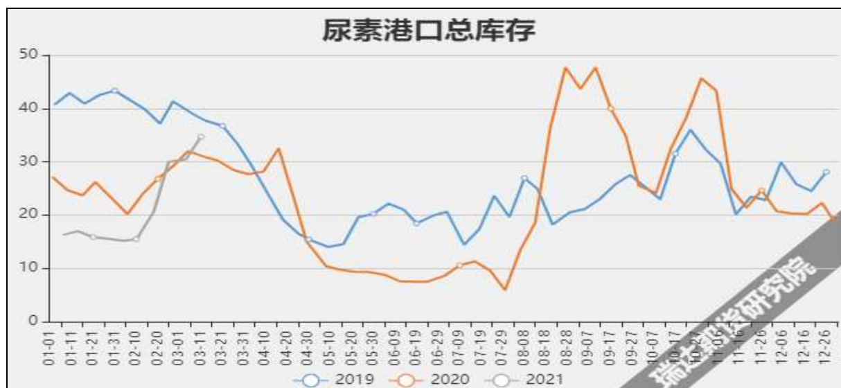
图9 国内尿素港口库存