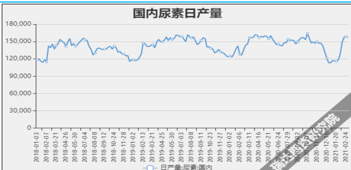
图7 国内尿素日产量