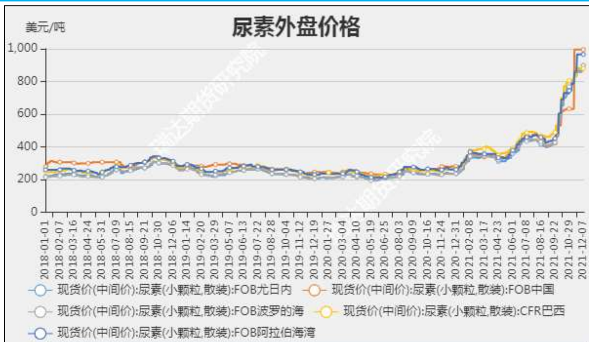
图4 尿素外盘现货价