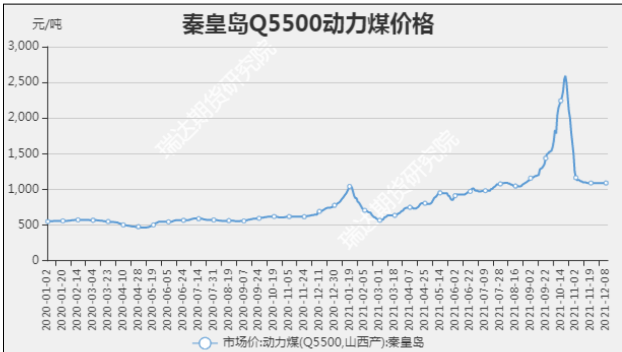
图1 秦皇岛动力煤市场价