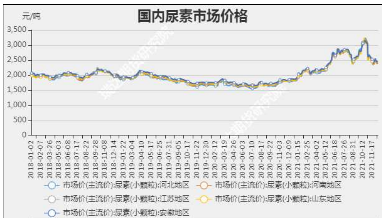
图3 国内尿素市场主流价

截至12月09日, NYMEX天然气收盘价3.79美元/百万英热单位, 较上周-0.32美元/百万英热单位。