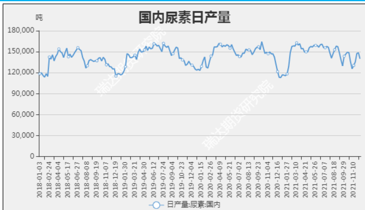
图7 国内尿素日产量