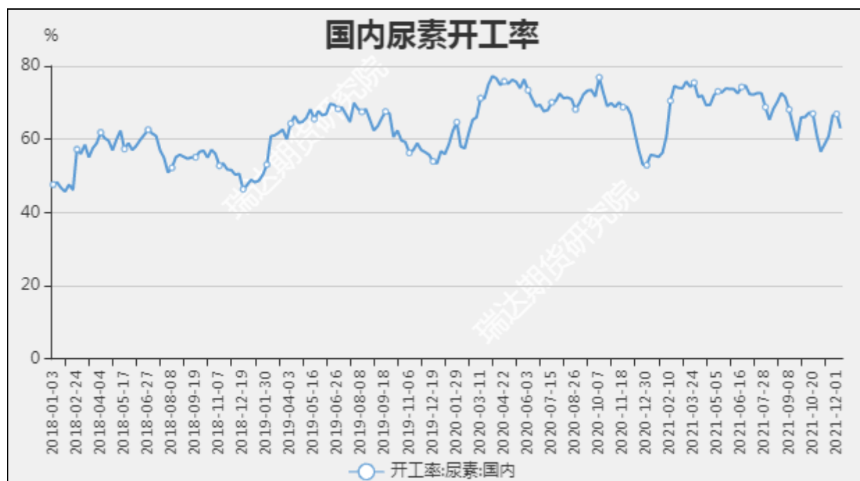
图8 国内尿素开工率