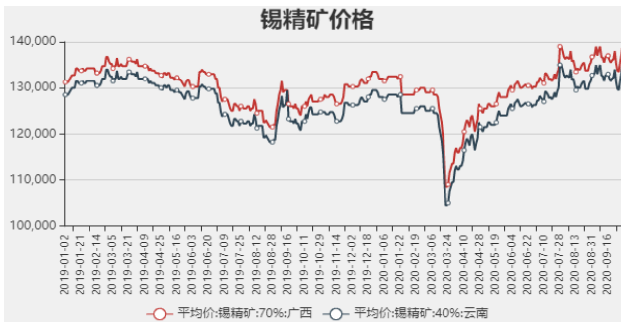
图2：国内锡精矿价格

截止至2020年10月09日，国内广西锡精矿70%价格为139500元/吨，云南锡精矿40%价格为135500元/吨。