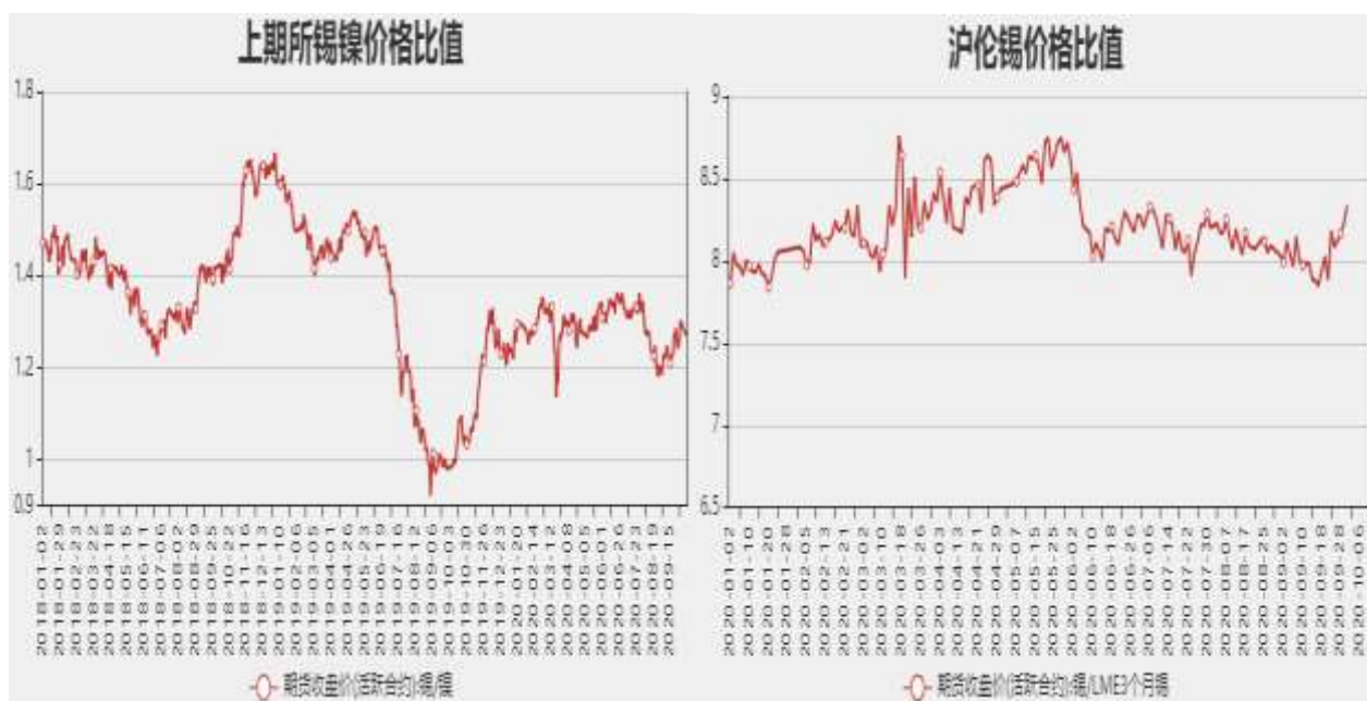
图8：沪伦锡价格比率

截止至2020年09月30日，锡镍以收盘价计算当前比价为1.3026，沪伦锡比值为8.3381。