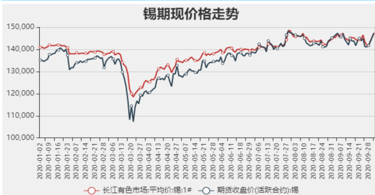
图1：国内锡现货价格

截止至2020年10月09日，长江有色市场1#锡平均价为147500元/吨，沪锡期货价格为147290元/吨。