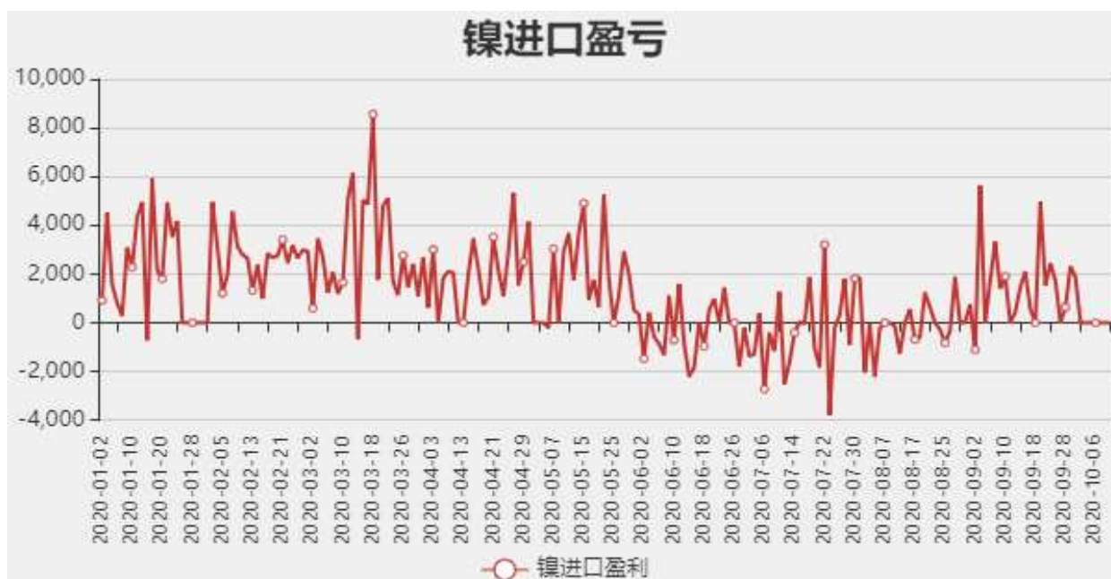
图5：镍进口盈亏分析

截止至2020年09月25日，全国主要港口统计镍矿库存为824.87万吨，较上周增加52.23万吨。截止至10月09日，菲律宾镍矿:Ni:1.5-1.6Fe:25-30%:华东价格为675元/吨。