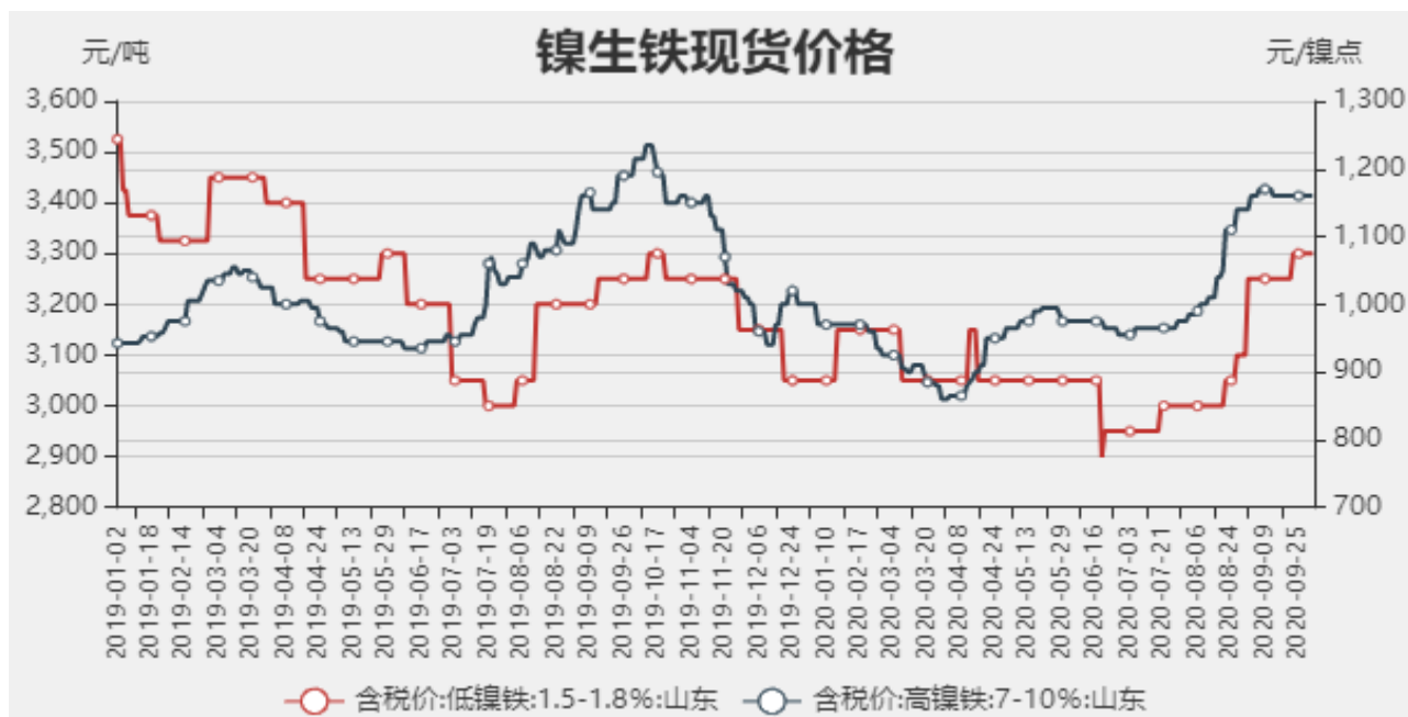
图1：镍生铁现货价格

截止至2020年09月29日，以山东地区为例，低镍铁（FeNi1.5-1.8）价格为3300元/吨，较上周持平，高镍生铁（FeNi7-10）价格为1160元/镍点，较上周持平。