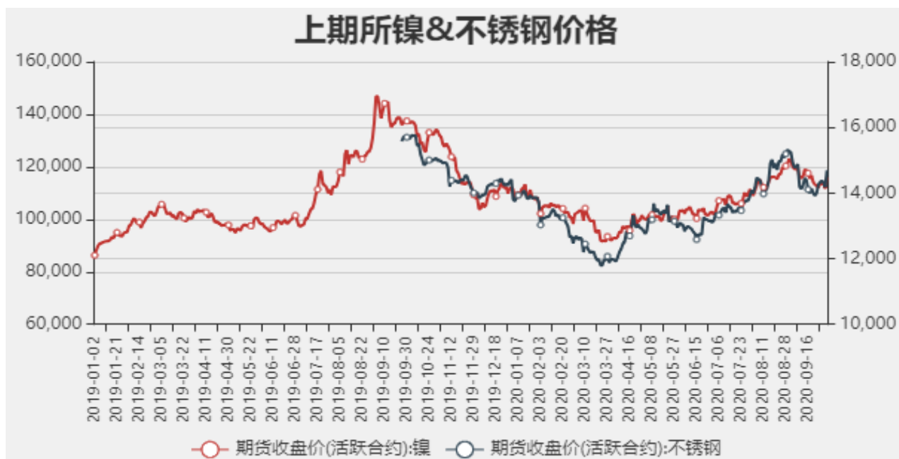
图2：国内镍现货价格

截止至2020年10月9日，沪镍期货价格为115940元/吨，不锈钢期货价格为14690元/吨。