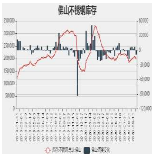
图7：佛山不锈钢月度库存