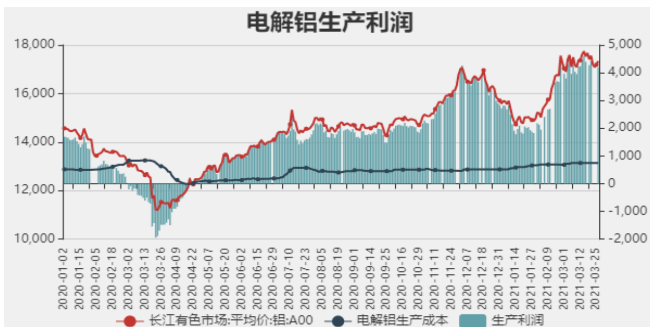
图11：电解铝生产利润