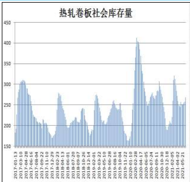
图10：全国33城热卷社会库存

6月24日，据Mysteel监测的全国33个主要城市社会库存为278.68万吨，较上周增加9.77万吨，较去年同期增加30.99万吨。