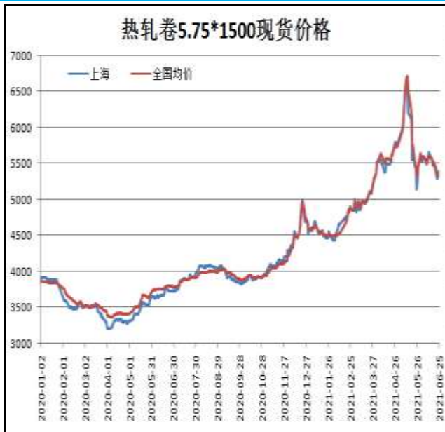
图1：热轧卷板现货价

6月25日，上海热轧卷板5.75mm Q235现货报价为5400元/吨，周环比-120元/吨；全国均价为5379元/吨，周环比-143元/吨。