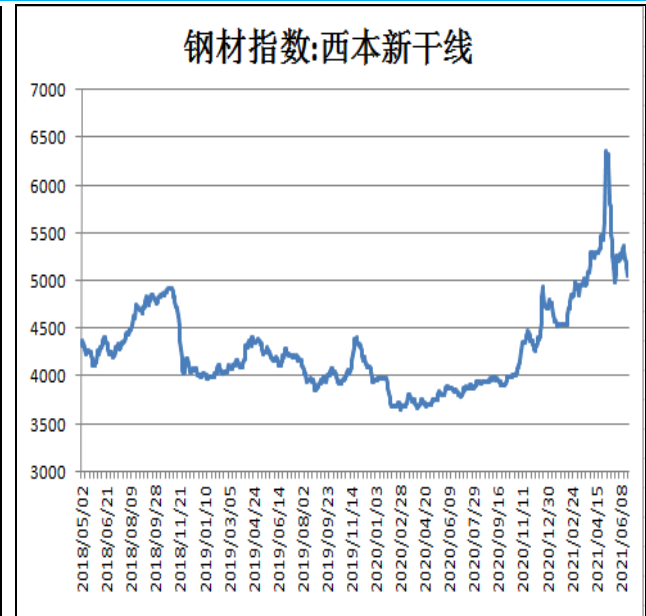
图2：西本新干线钢材价格指数

6月25日，上海热轧卷板5.75mm Q235现货报价为5400元/吨，周环比-120元/吨；全国均价为5379元/吨，周环比-143元/吨。