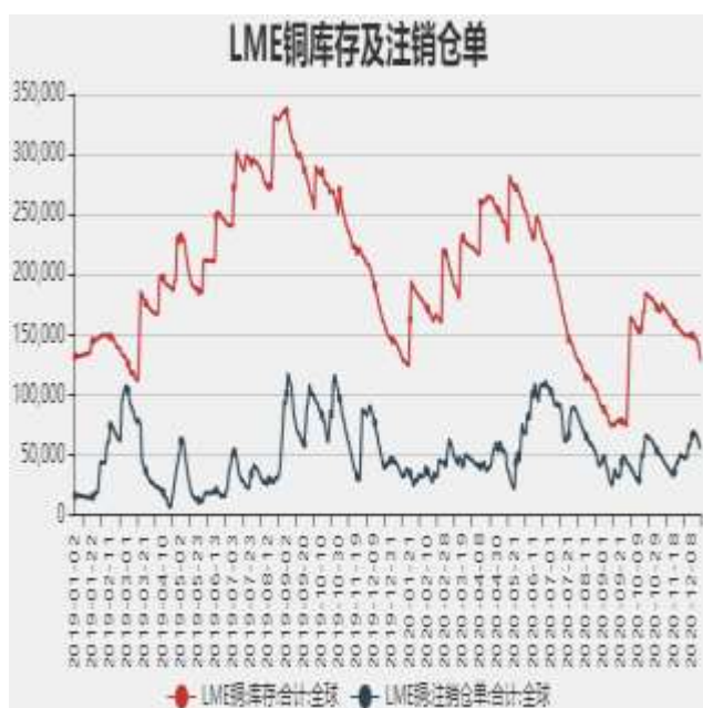
图7：LME铜库存及注销仓单