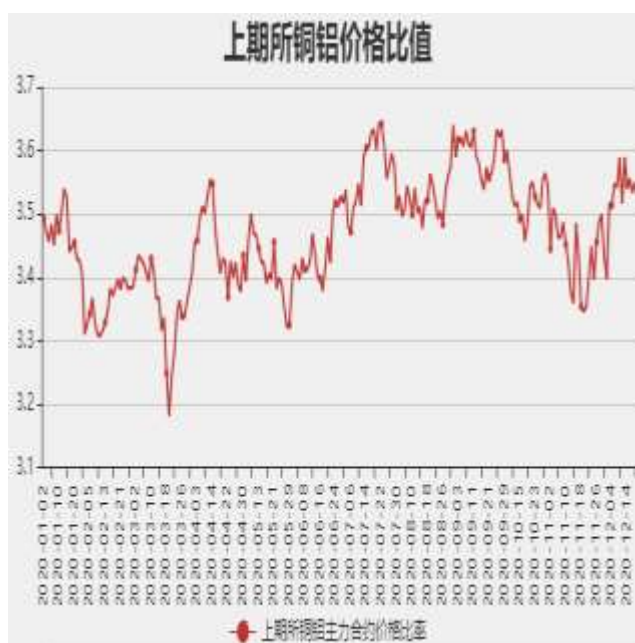
图9：沪铜和沪铝主力合约价格比率