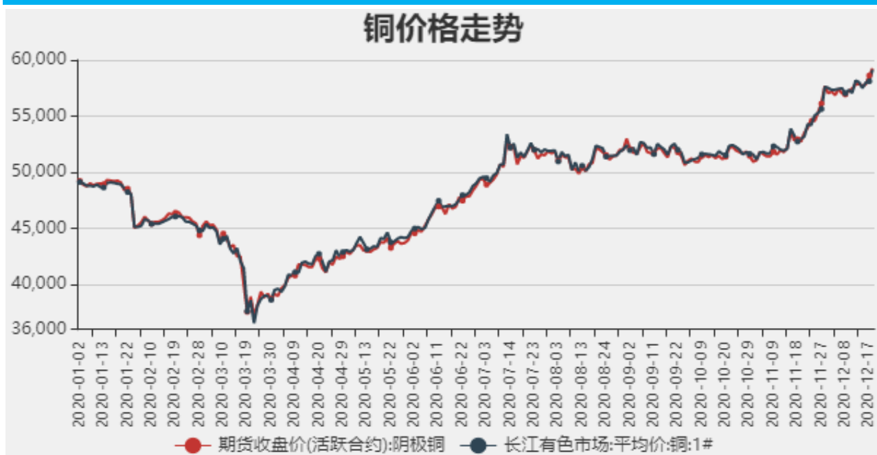
图1：铜期现价格走势

截止至2020年12月18日，长江有色市场1#电解铜平均价为59260元/吨；电解铜期货价格为59150元/吨。