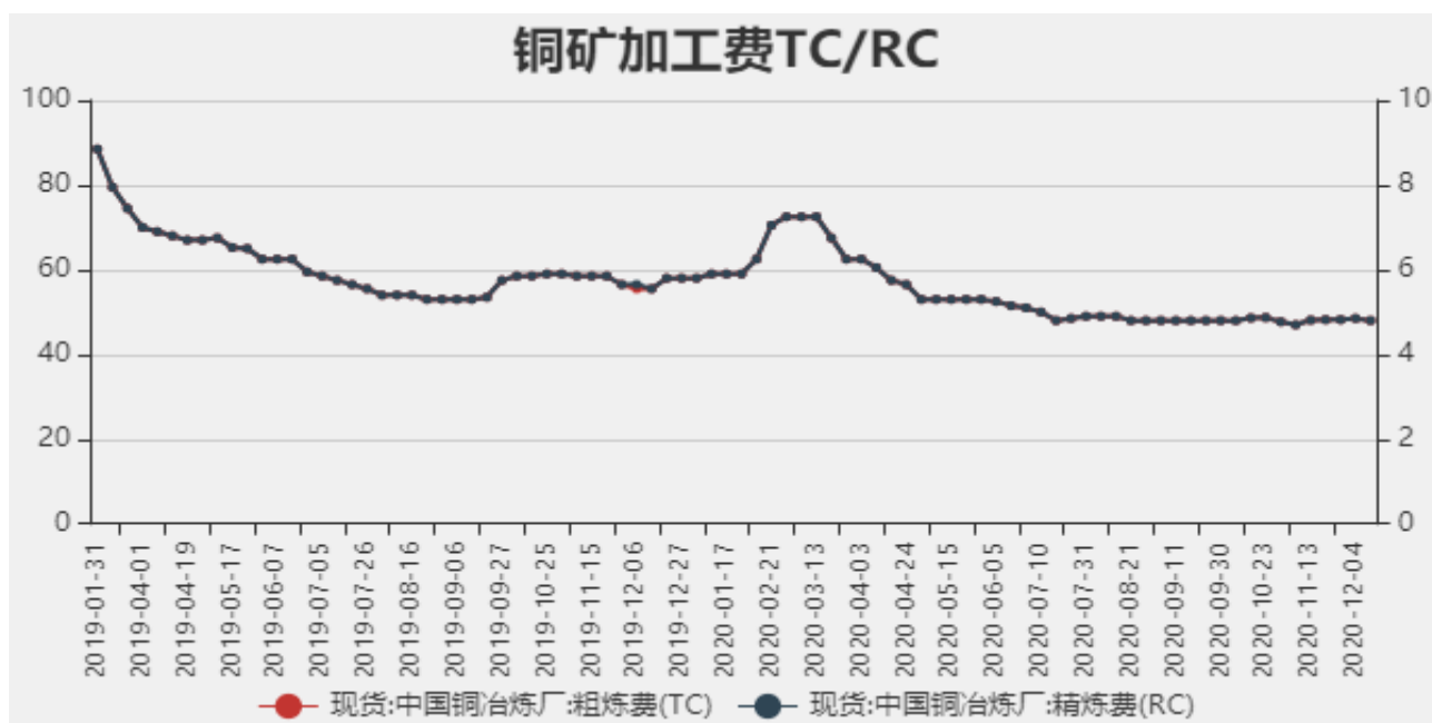
图2：中国铜冶炼加工费

2020年12月11日中国铜冶炼厂粗炼费（TC）为48美元/干吨，精炼费（RC）为4.8美分/磅，较上周下调0.5美元/干吨。