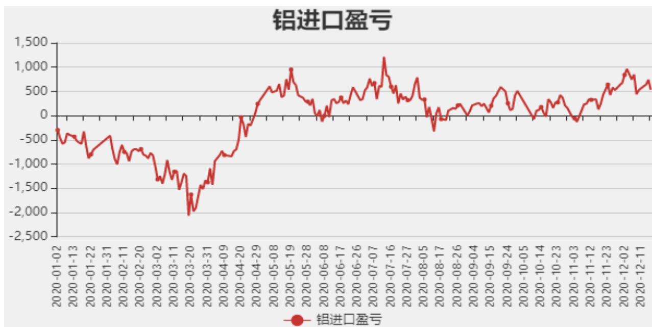
图5：铝进口利润和沪伦比值

截止至12月17日，贵阳氧化铝价格为2290元/吨；库存方面，截止至12月11日，国内总计库存为60.2万吨。