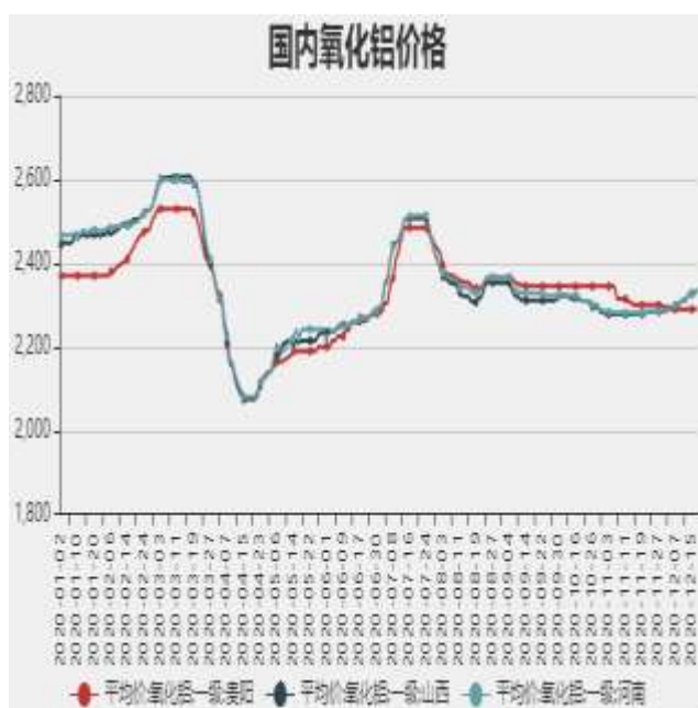
图3：国内氧化铝价格