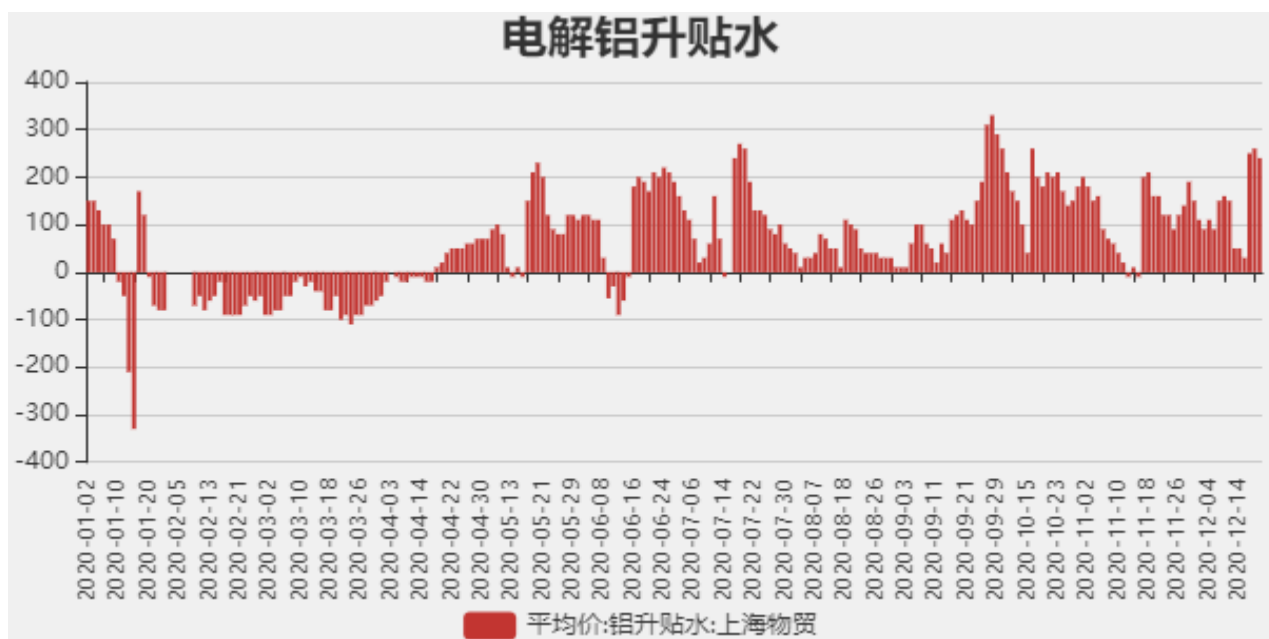
图2：电解铝升贴水走势图

截止至2020年12月18日，长江有色市场1#电解铝平均价为16780元/吨，沪铝期货价格为16960元/吨。