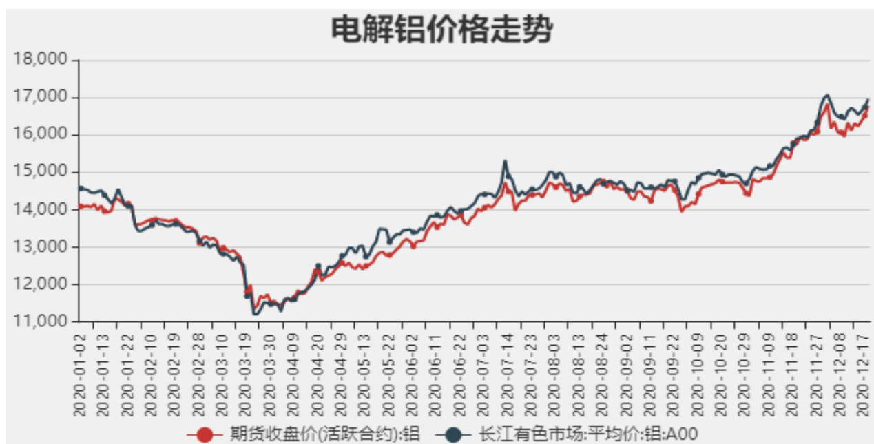
图1：电解铝期现价格

截止至2020年12月18日，长江有色市场1#电解铝平均价为16780元/吨，沪铝期货价格为16960元/吨。