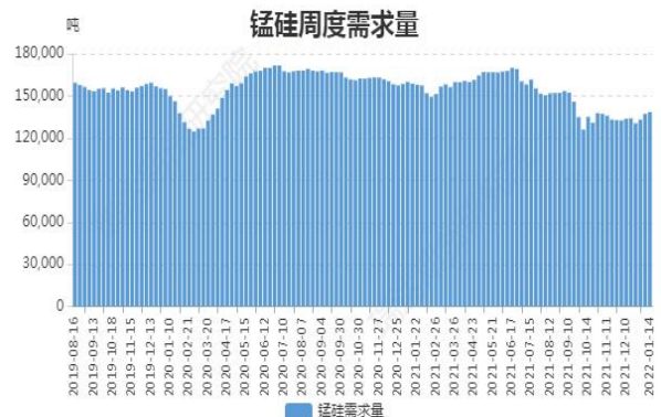
图16: 锰硅周度需求量

截止1月14日, 全国锰硅需求量(周需求): 138478吨, 环比上周增0.93%。