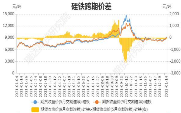
图5：硅铁期货跨期价差

截止1月14日，期货SF2205与SF2209（远月-近月）价差为-98元/吨，较前一周涨30元/吨。