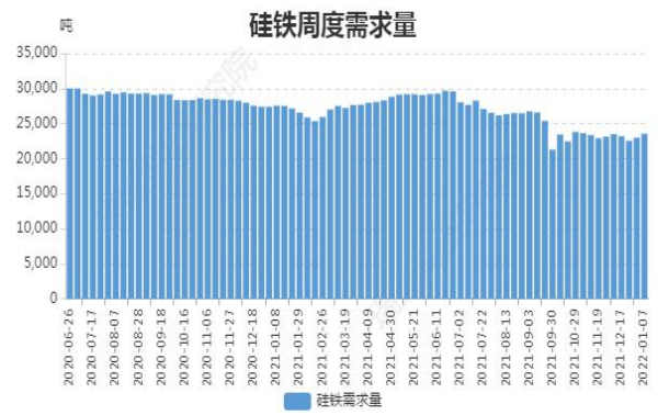
图14: 硅铁周度需求量

截至1月7日, 全国硅铁需求量(周需求): 23550.5吨, 环比上周增554.7吨。