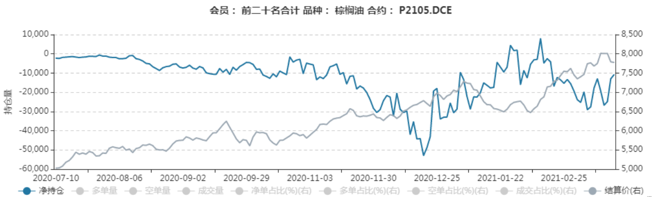
图1: 棕榈油2105合约前二十名净持仓和结算价