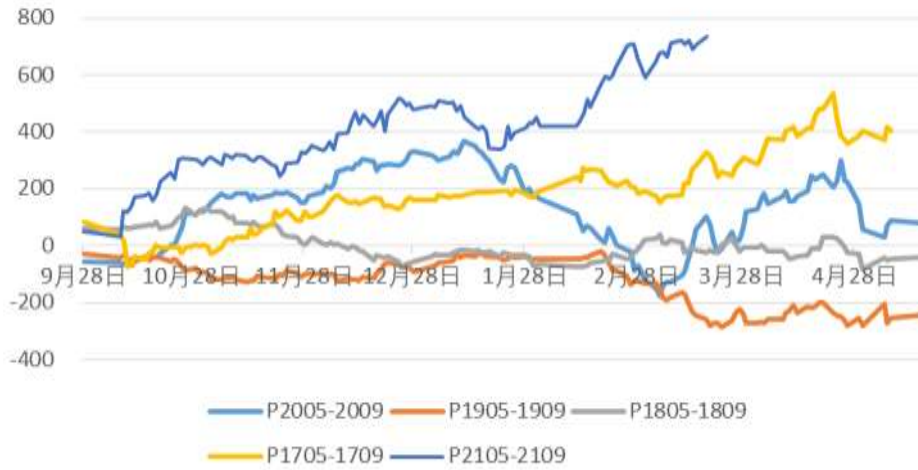
棕榈油5月与9月历史价差