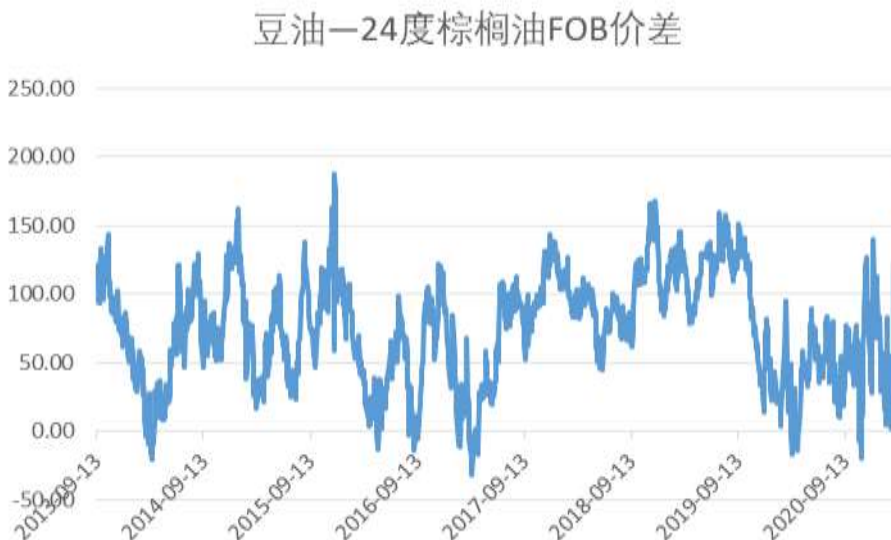
图4：豆油—24度棕榈油FOB价差