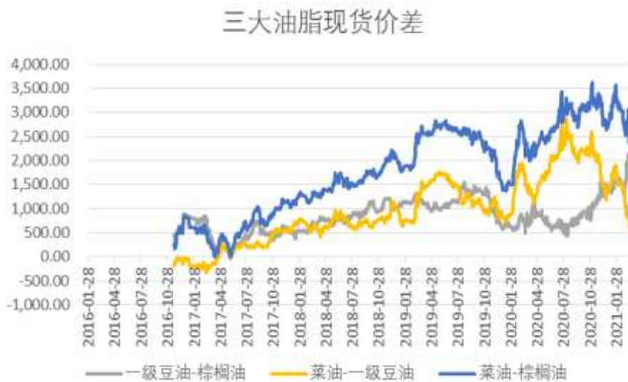
图5：三大油脂间现货价差波动