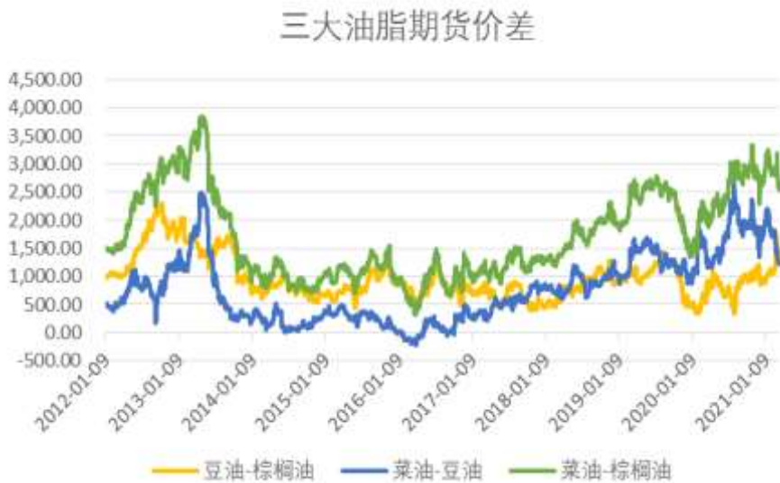
图11：三大油脂间期货价差波动