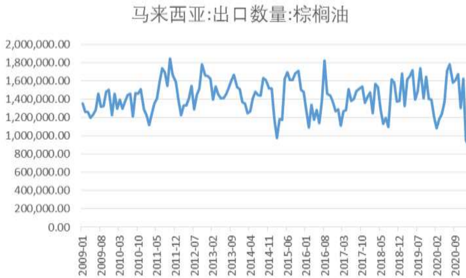
图7：马来西亚周度棕榈油出口