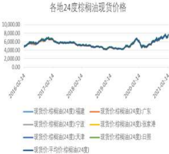
图2：各地区24度棕榈油现货价格