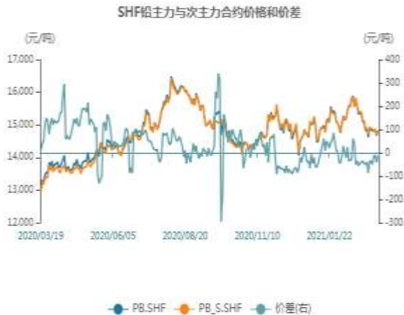
图5：沪铅主力与次主力价差走势图