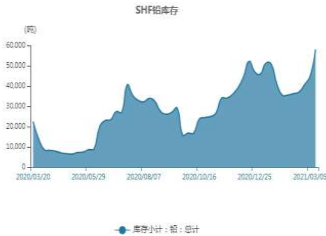
图12：上海铅库存走势图