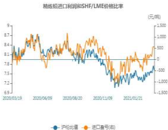
图1：铅两市比值走势图