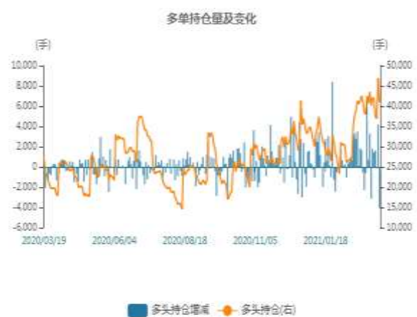
图2：沪铅多头持仓走势图