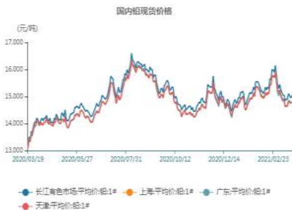
图7、国内铅现货价格走势图