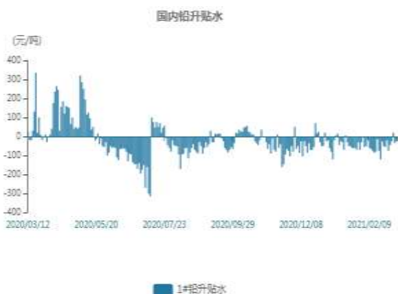
图10：国内铅现货升贴水走势图