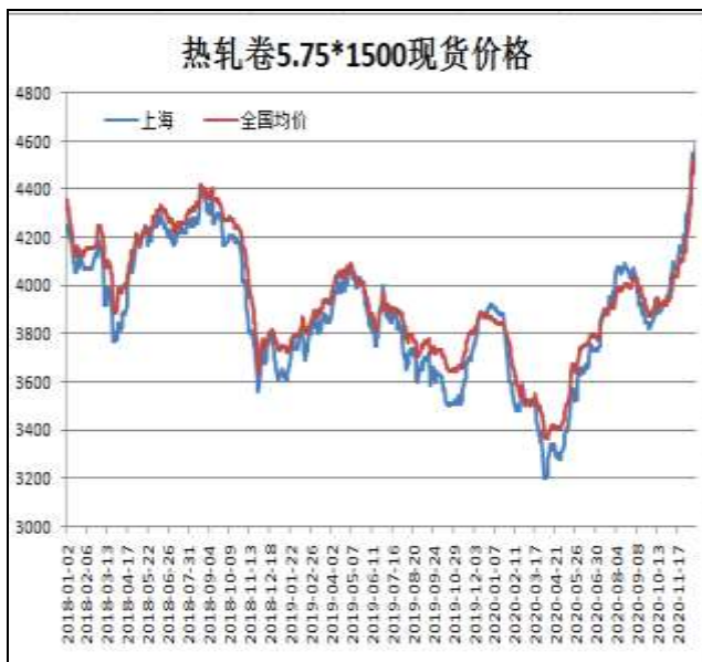
图1：热轧卷板现货价

12月18日，上海热轧卷板5.75mm Q235现货报价为4600元/吨，周环比+50元/吨；全国均价为4577元/吨，周环比+81元/吨。