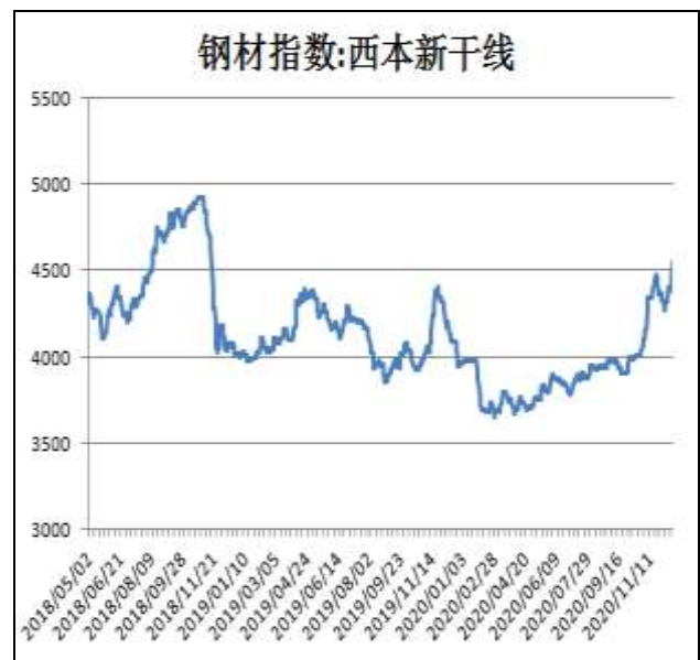
图2：西本新干线钢材价格指数

12月18日，上海热轧卷板5.75mm Q235现货报价为4600元/吨，周环比+50元/吨；全国均价为4577元/吨，周环比+81元/吨。