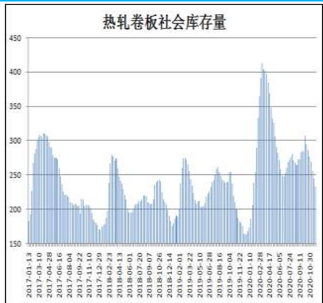
图10：全国33城热卷社会库存

12月17日，据Mysteel监测的全国33个主要城市社会库存为190.78万吨，较上周减少6.73万吨，较去年同期增加26.76万吨。