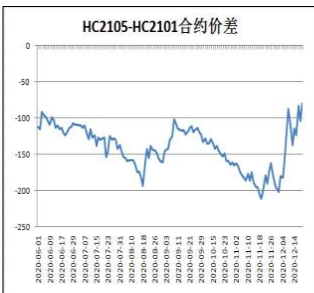
图6：热卷与螺纹跨品种套利

本周，HC2105合约走势强于HC2101合约，18日价差为-80元/吨，较上周五+57元/吨。