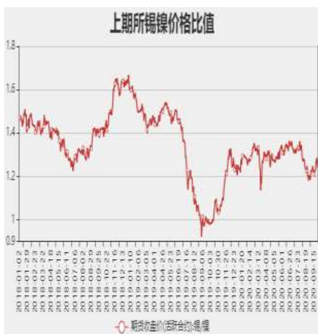
图8：沪伦锡价格比率