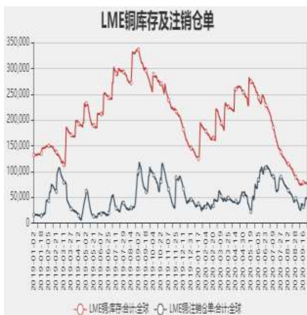
图7：LME铜库存及注销仓单