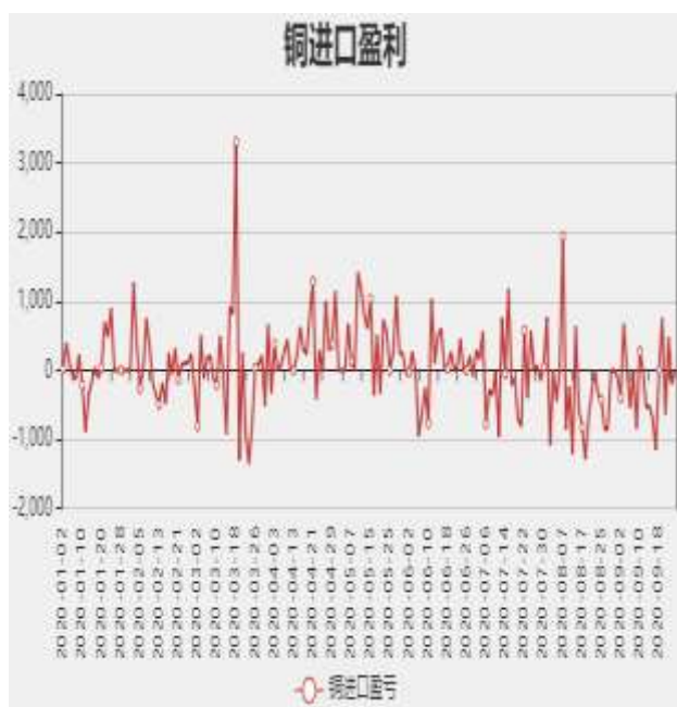
图3：精炼铜进口利润