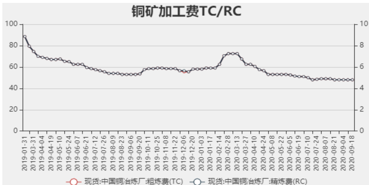
图2：中国铜冶炼加工费

2020年09月18日中国铜冶炼厂粗炼费（TC）为48美元/干吨，精炼费（RC）为4.8美分/磅，较上周持平。