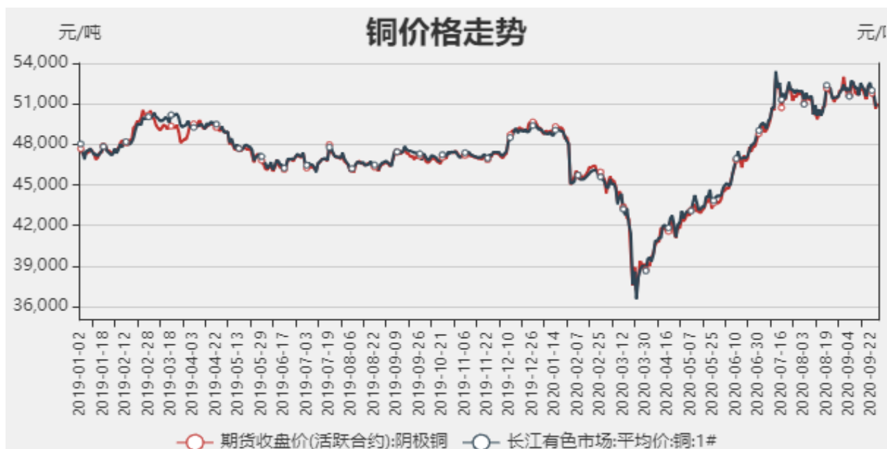
图1：铜期现价格走势

截止至2020年09月25日，长江有色市场1#电解铜平均价为51040元/吨；电解铜期货价格为50890元/吨。