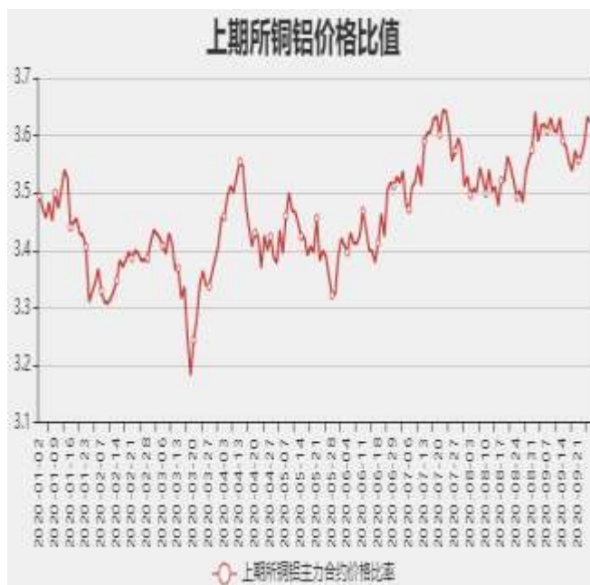
图9：沪铜和沪铝主力合约价格比率