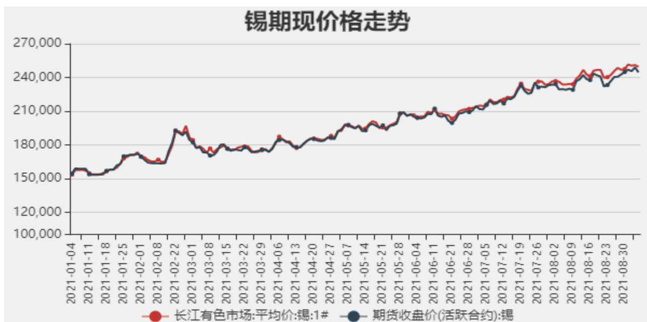
图1：国内锡现货价格

截止至2021年9月3日，长江有色金属1#锡平均价为249500元/吨，沪锡期货价格为244530元/吨。