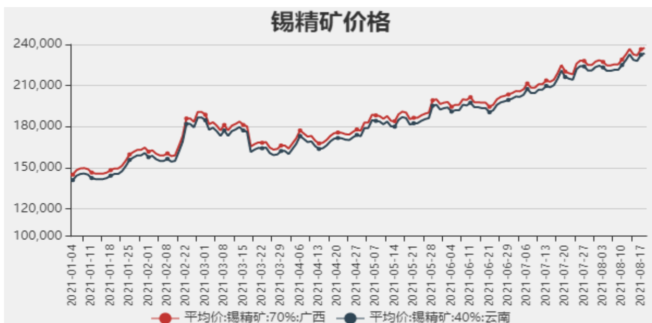
图3：国内锡精矿价格

截止2021年8月18日，国内广西锡精矿70%价格为237500元/吨，云南锡精矿40%价格为233500元/吨。