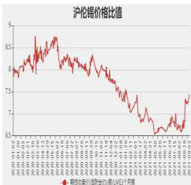
图8：沪锡和沪镍主力合约价格比率