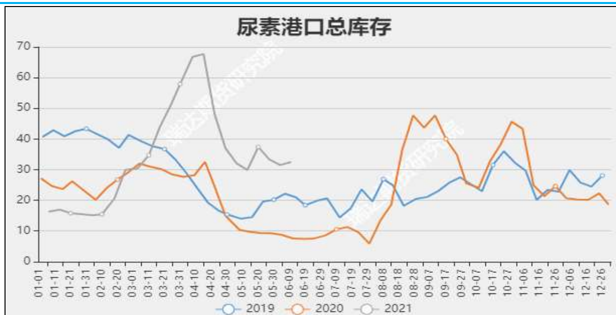
图9 国内尿素港口库存