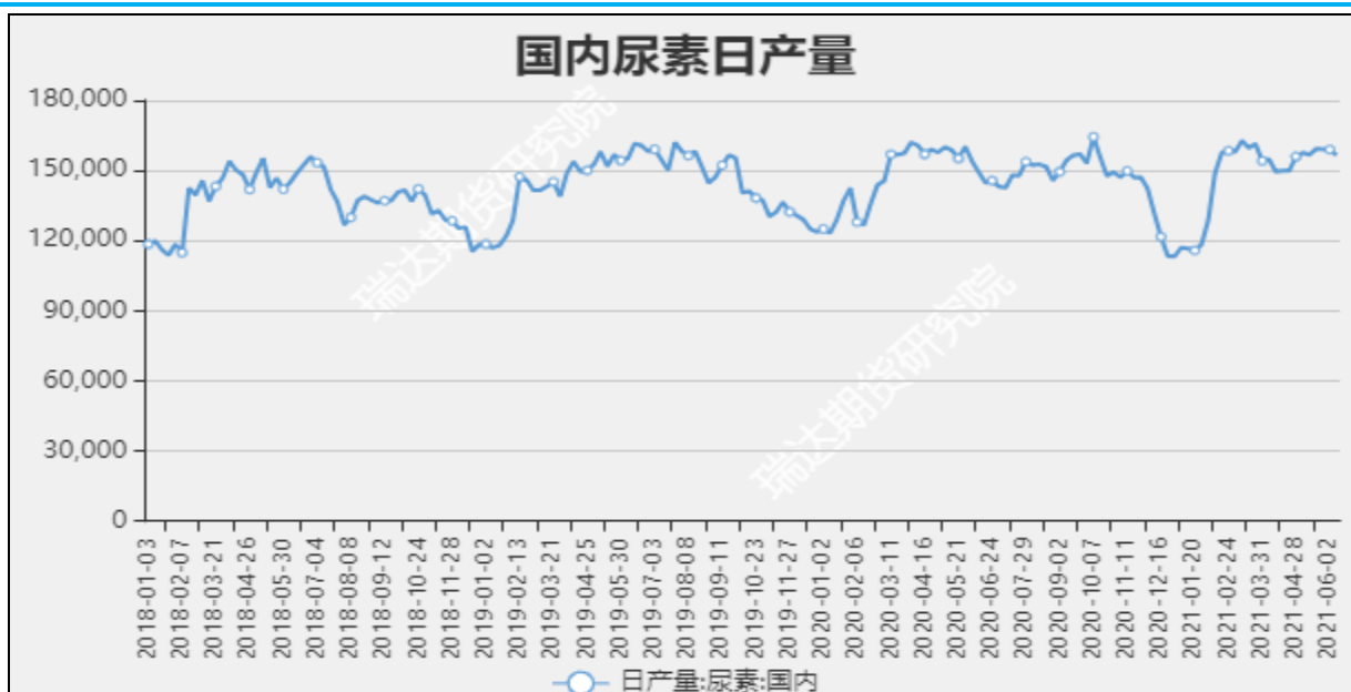
图7 国内尿素日产量