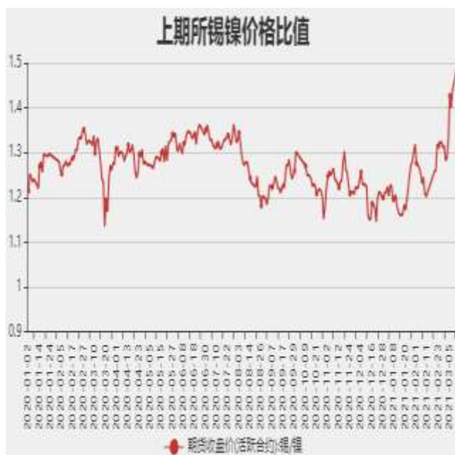
图8：沪伦锡价格比率