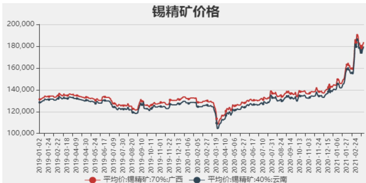
图2：国内锡精矿价格

截止至2021年3月12日，国内广西锡精矿70%价格为183750元/吨，云南锡精矿40%价格为179750元/吨。