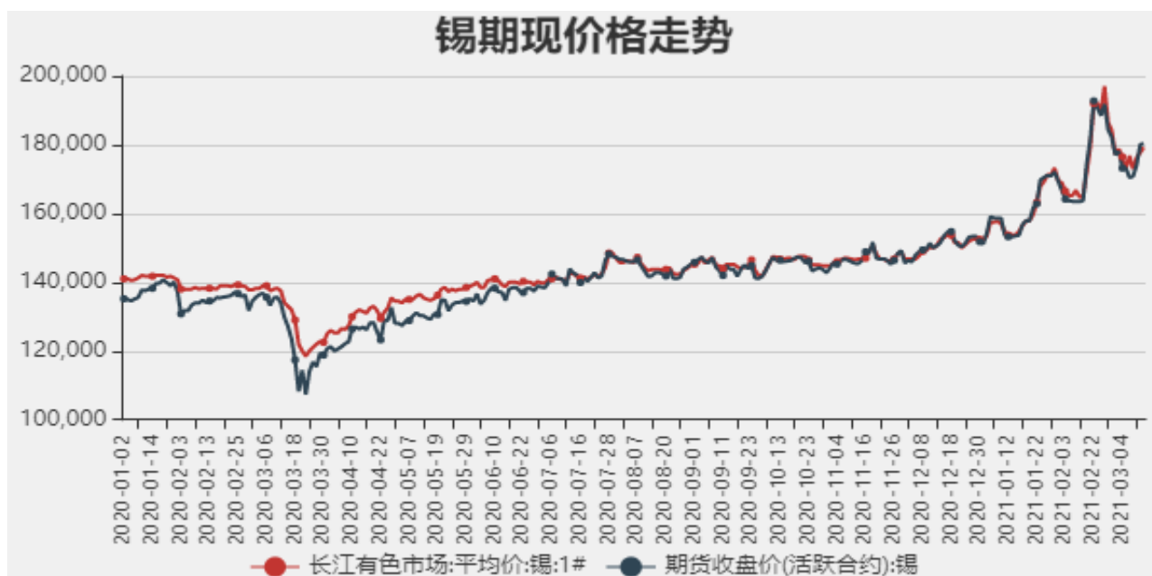
图1：国内锡现货价格

截止至2021年3月12日，长江有色金属市场1#锡平均价为179250元/吨，沪锡期货价格为180370元/吨。