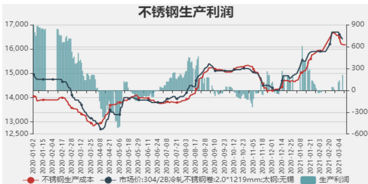
图10：不锈钢生产利润