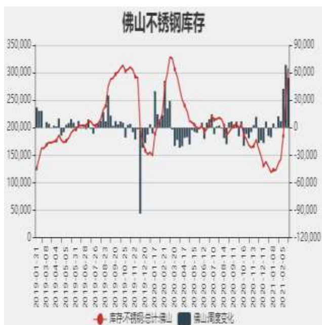
图7：佛山不锈钢月度库存