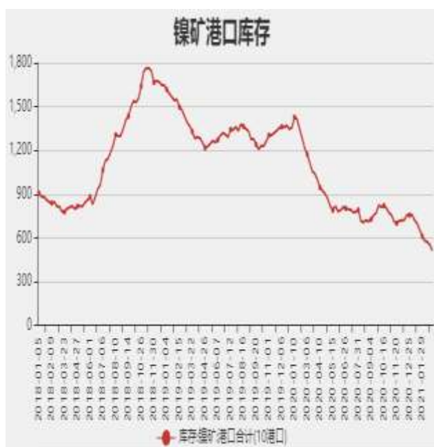
图3：国内镍矿港口库存