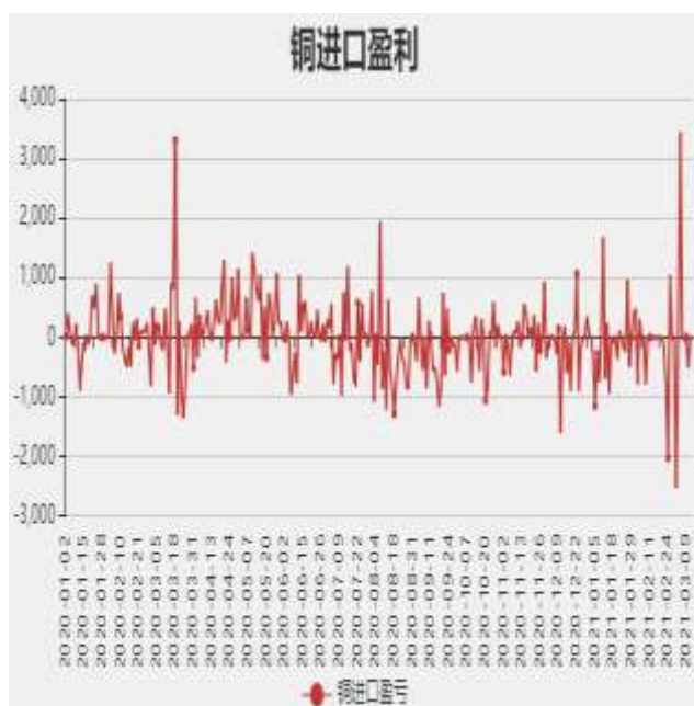
图3：精炼铜进口利润