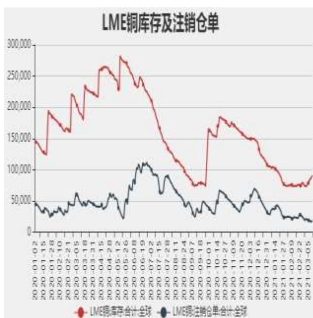
图7：LME铜库存及注销仓单