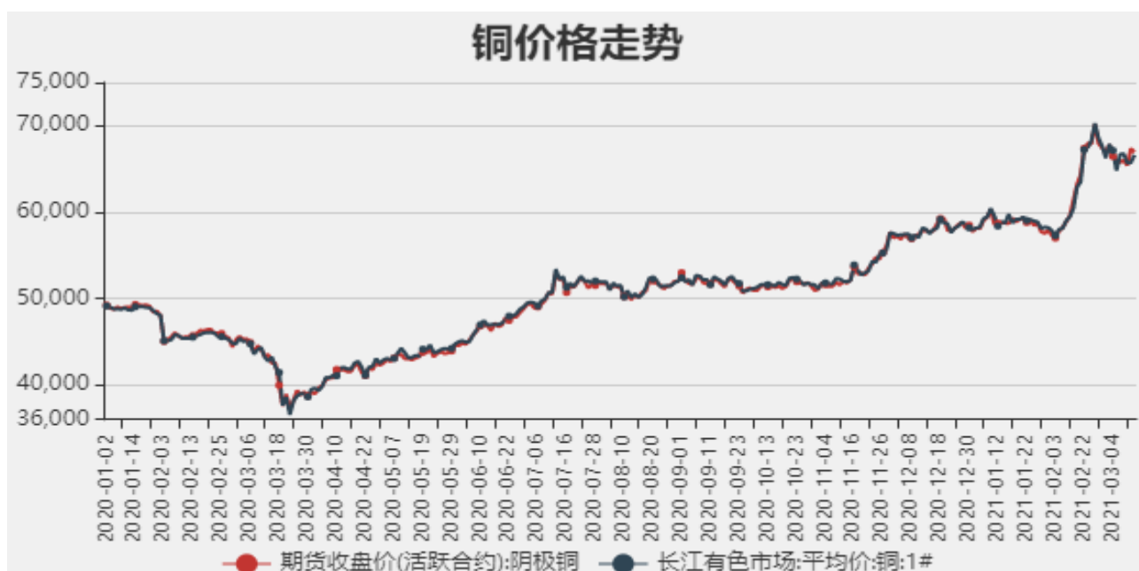
图1：铜期现价格走势

截止至2021年3月12日，长江有色市场1#电解铜平均价为66920元/吨；电解铜期货价格为66620元/吨。