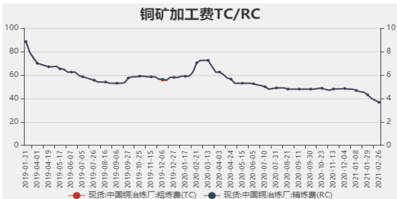
图2：中国铜冶炼加工费

2021年2月26日中国铜冶炼厂粗炼费（TC）为36.7美元/干吨，精炼费（RC）为3.67美分/磅，较上周下调1.8美元/干吨。