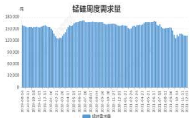
图16: 锰硅周度需求量

截止 12 月 3 日, 全国锰硅需求量(周需求): 132447 吨, 环比上周降 0.16%。