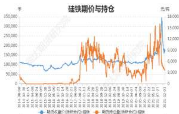
图3：硅铁期价与持仓

截止 12 月 3 日，硅铁期货主力合约收盘价 8712 元/吨，较前一周涨 46 元/吨；硅铁期货主力合约持仓量 70993 手，较前一周减 2273 手。