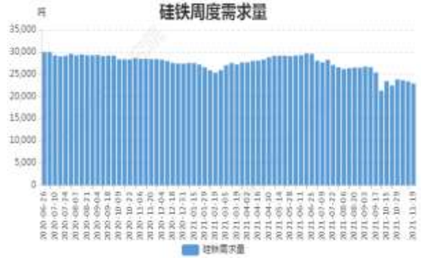
图14: 硅铁周度需求量

截至 11 月 19 日, 全国硅铁需求量(周需求): 22902.2 吨, 环比上周降 2.02%。