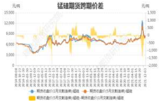
图6：锰硅期货跨期价差

截止 12 月 3 日，期货 SM2201 与 SM2205（远-月-近月）价差为 40 元/吨，较前一周涨 72 元/吨。