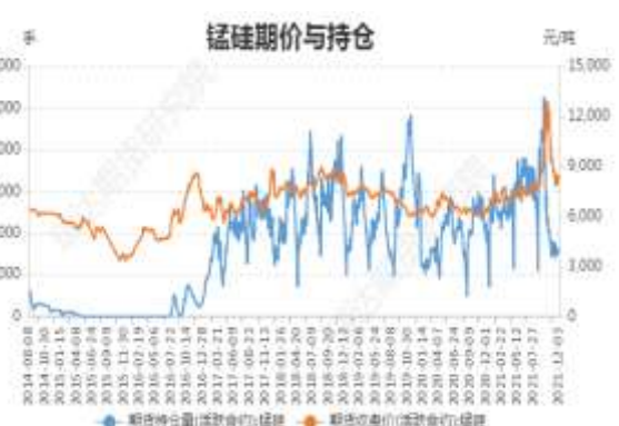
图4：锰硅期价与持仓

截止 12 月 3 日，锰硅期货主力合约收盘价 8264 元/吨，较前一周涨 344 元/吨；锰硅期货主力合约持仓 77502 手，较前一周减 4789 手。