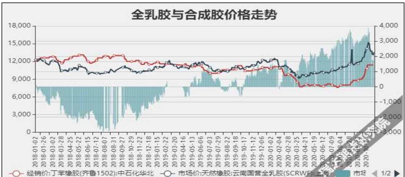
图12 全乳胶与合成胶价差

截至12月10日，华东市场丁苯橡胶12100元/吨，较上周+0元/吨；华北市场顺丁橡胶报11420元/吨，较上周+0元/吨。