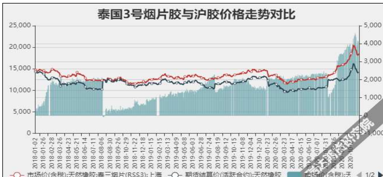
图10 泰国3号烟片与沪胶价差