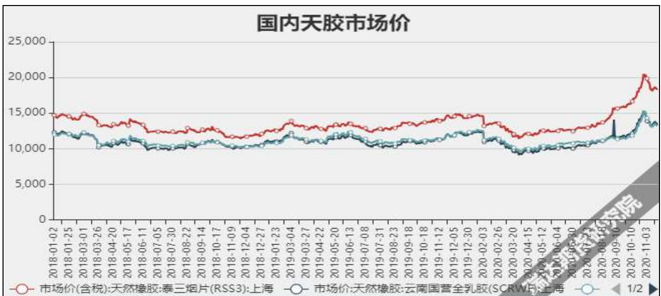
图4 国内天然橡胶市场价

截至12月11日，海南国营橡胶加工厂进浓乳厂制浓乳的原料收购价格13500（-800）元/吨，胶水制全乳胶12700（-800）元/吨。