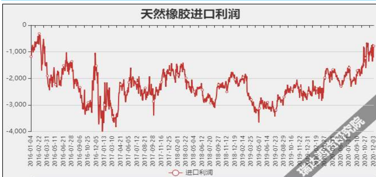
图16 天然橡胶进口利润

截至12月9日，烟片胶加工利润-12.54美元/吨，较上周-10.56美元/吨；标胶加工利润为-25.32美元/吨，较上周-25.34美元/吨。