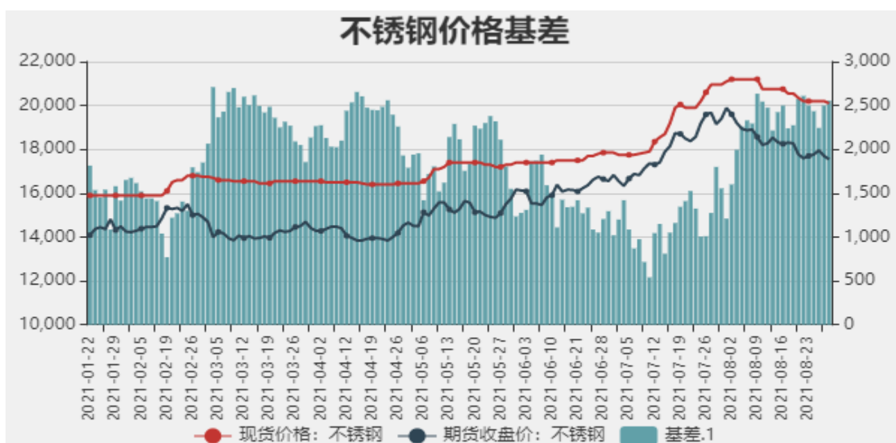
图4：不锈钢价格走势