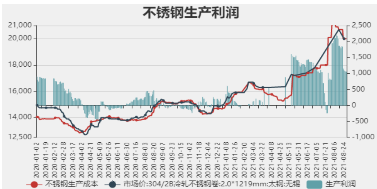
图11：不锈钢生产利润