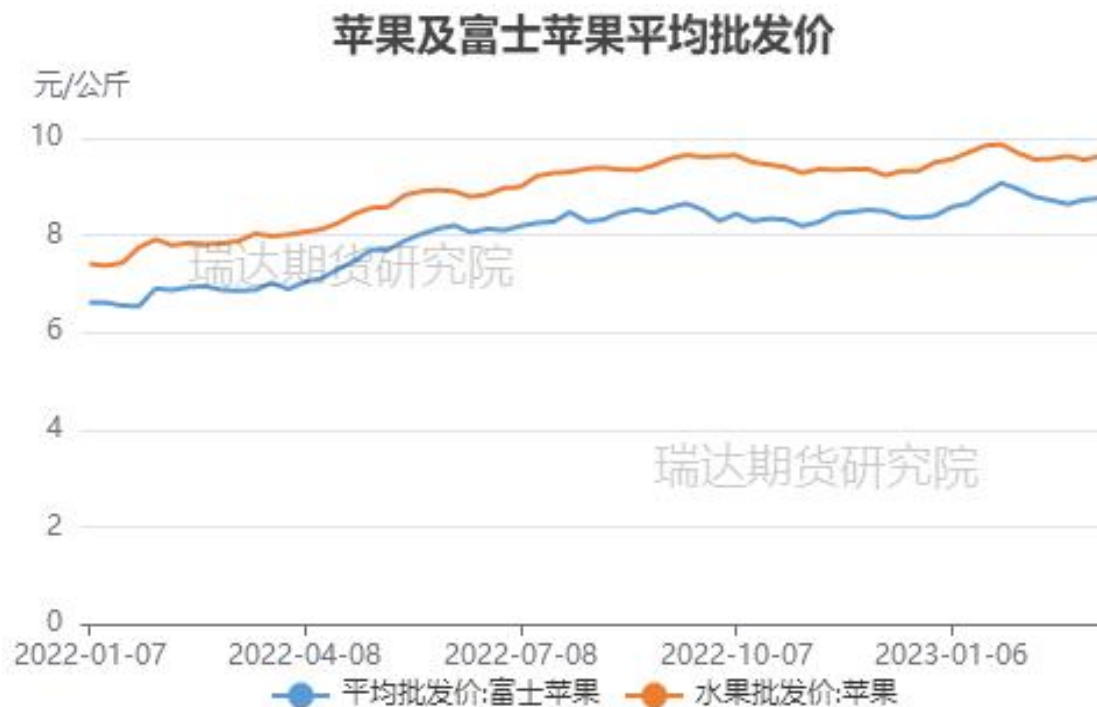
图、全品种苹果及富士苹果批发价格