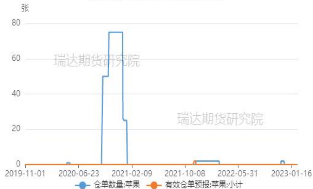
郑商所苹果仓单及有效预报