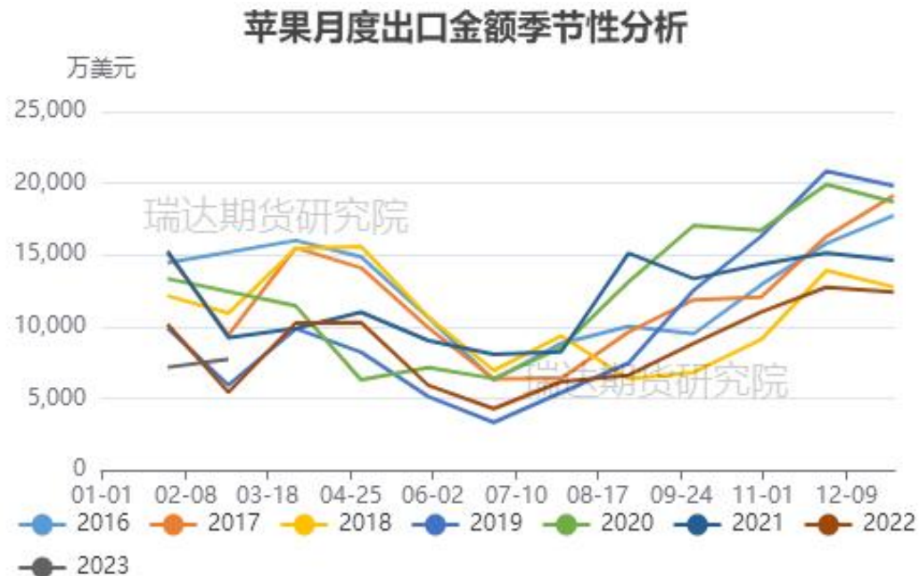
图、苹果出口金额季节性走势