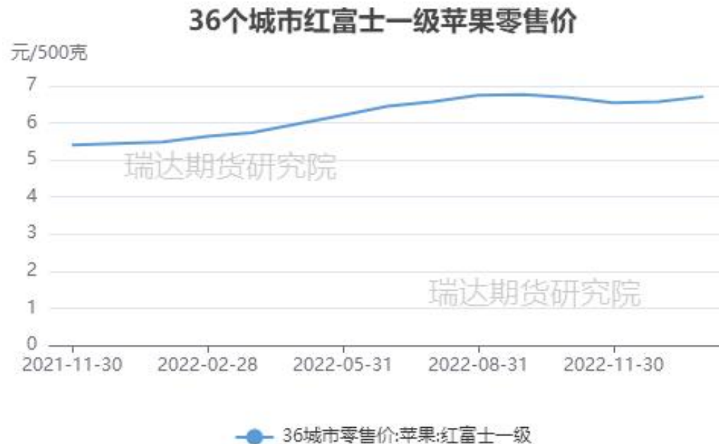
图、36个城市富士苹果零售价格走势