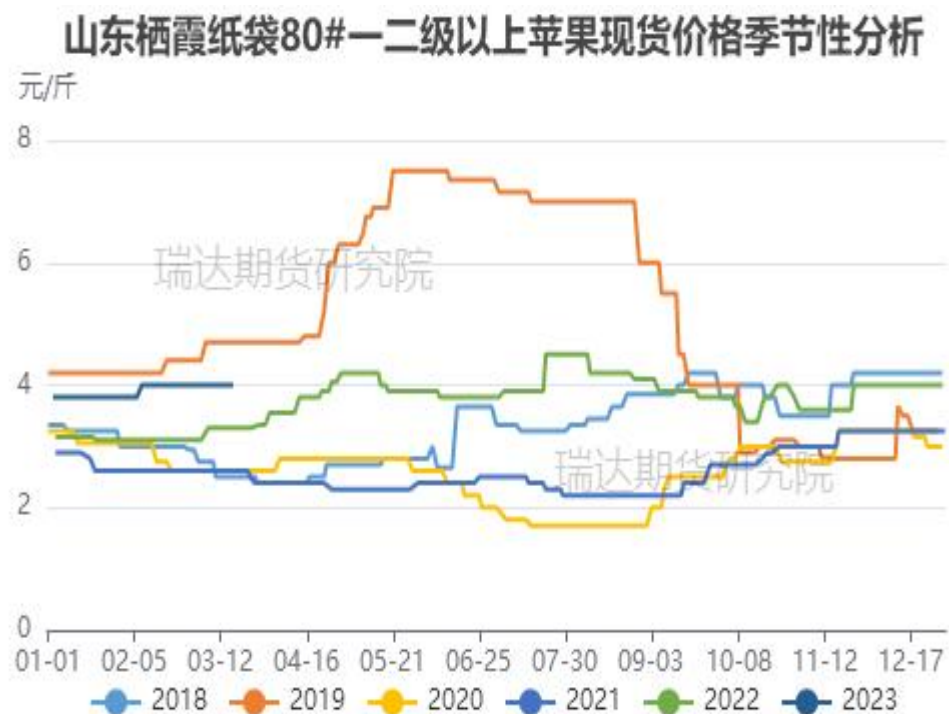
图、山东栖霞80#一二级苹果现货价格季节性走势