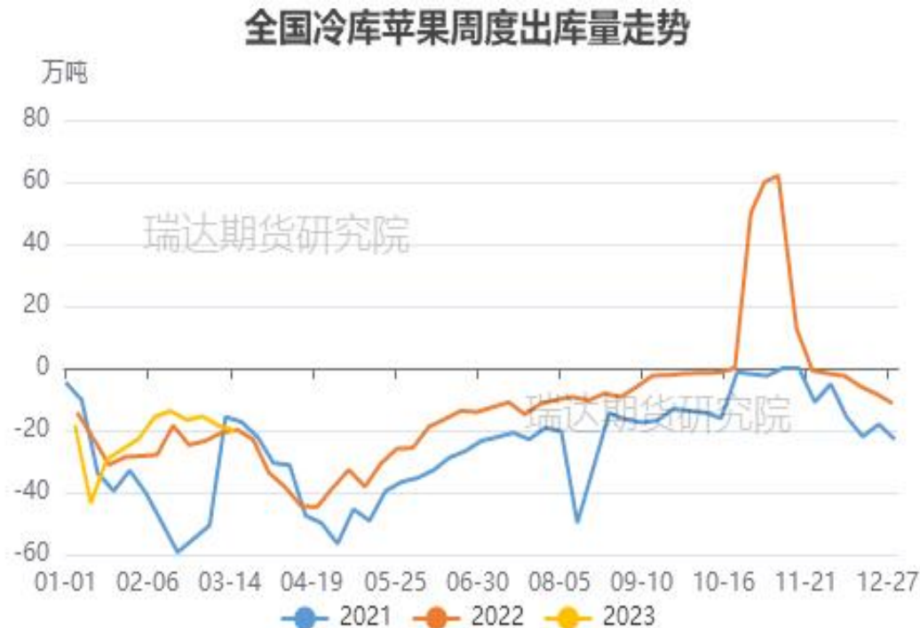
图、全国苹果冷库出库走势