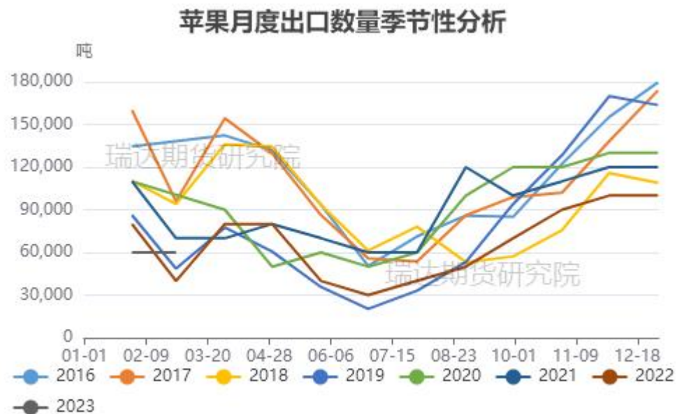
图、苹果出口量季节性情况