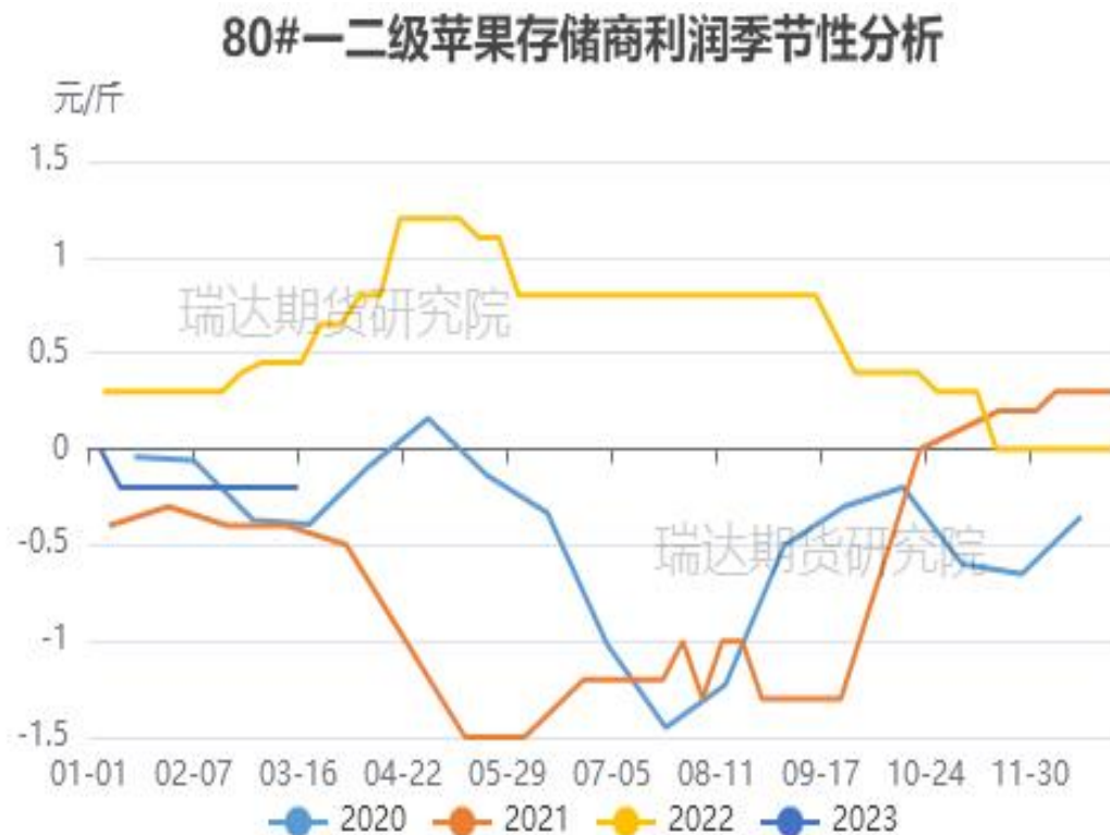
图、80#一二级富士存储商利润走势