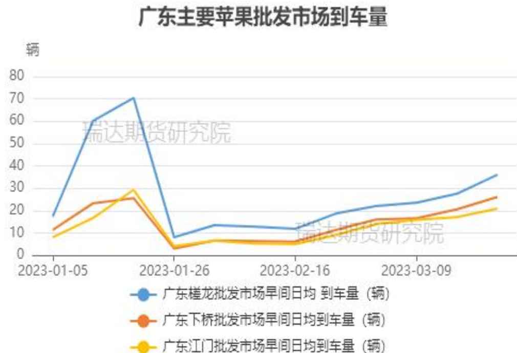
图、苹果批发市场-广东主要批发市场到车辆