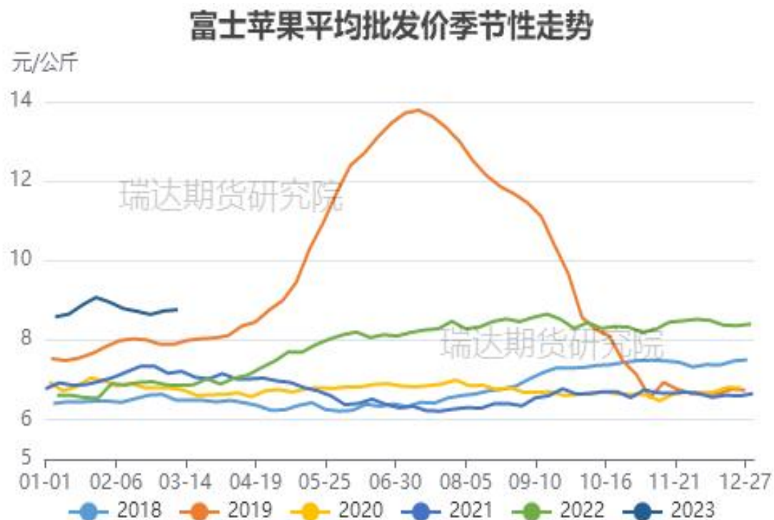
图、5种水果批发价格走势（富士、香蕉、葡萄、鸭梨和西瓜）