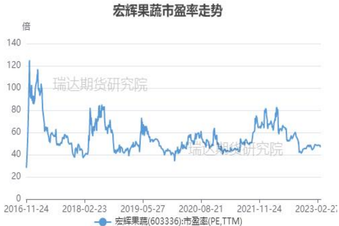
图、宏辉果蔬市盈率