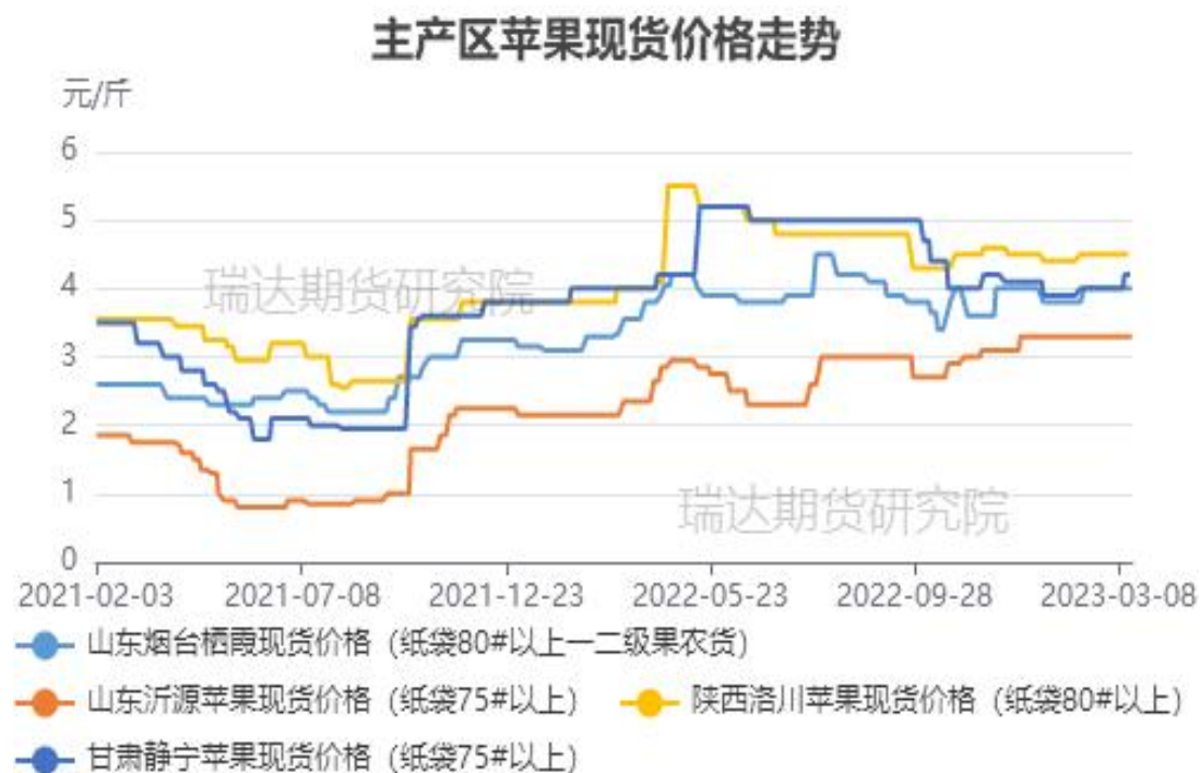
图、主产区苹果现货价格走势