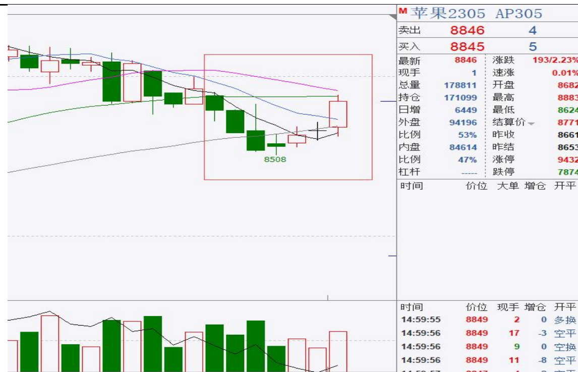
图、苹果主力合约价格走势