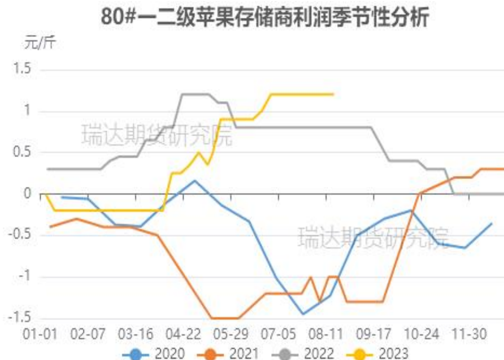
图、80#一二级富士存储商利润走势