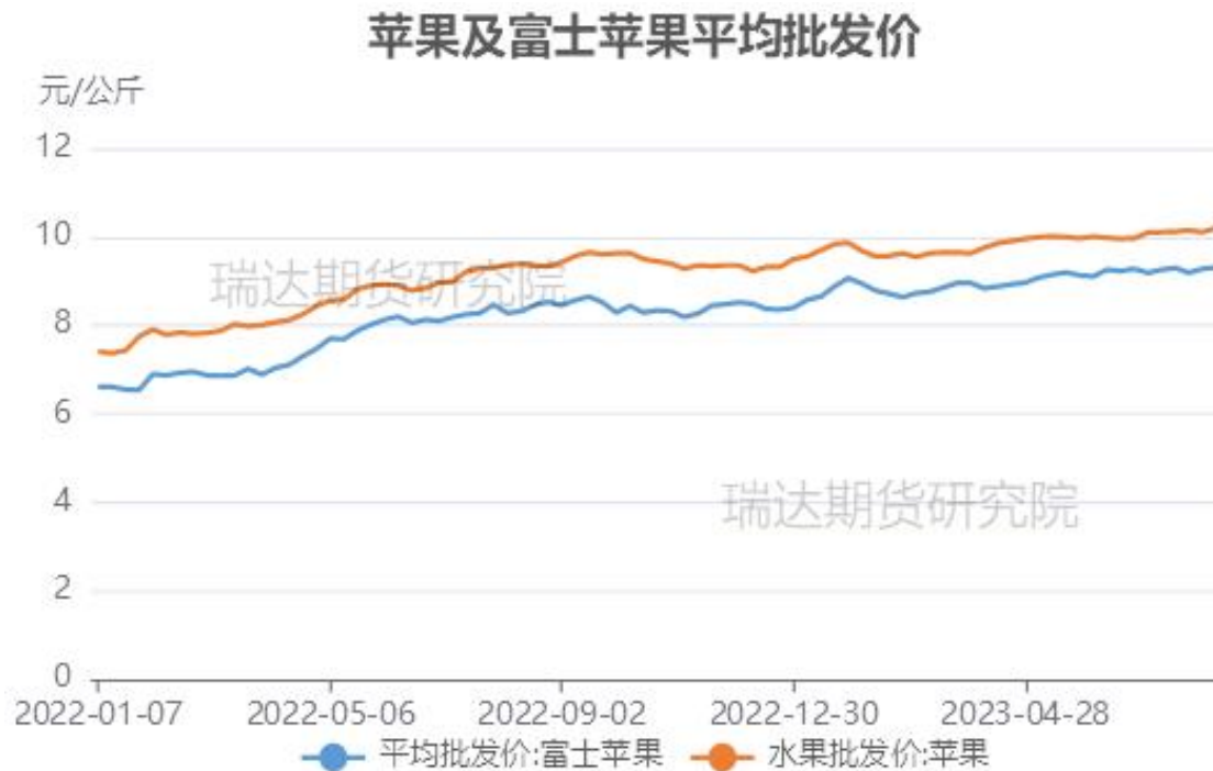
图、全品种苹果及富士苹果批发价格