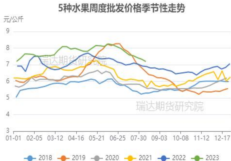
图、5种水果批发价格走势（富士、香蕉、葡萄、鸭梨和西瓜）