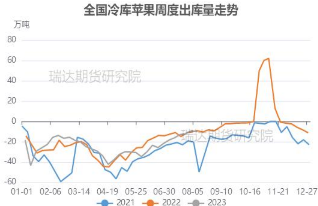
图、全国苹果冷库出库走势