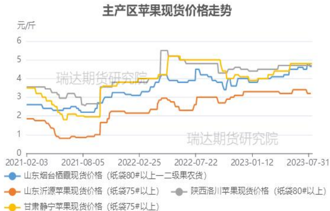
图、主产区苹果现货价格走势