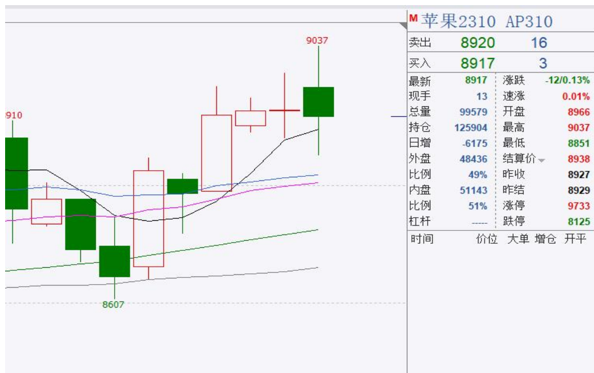
图、苹果主力合约价格走势