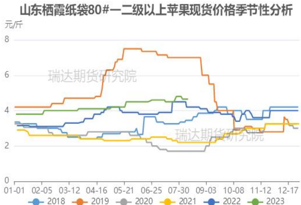
图、山东栖霞80#一二级苹果现货价格季节性走势