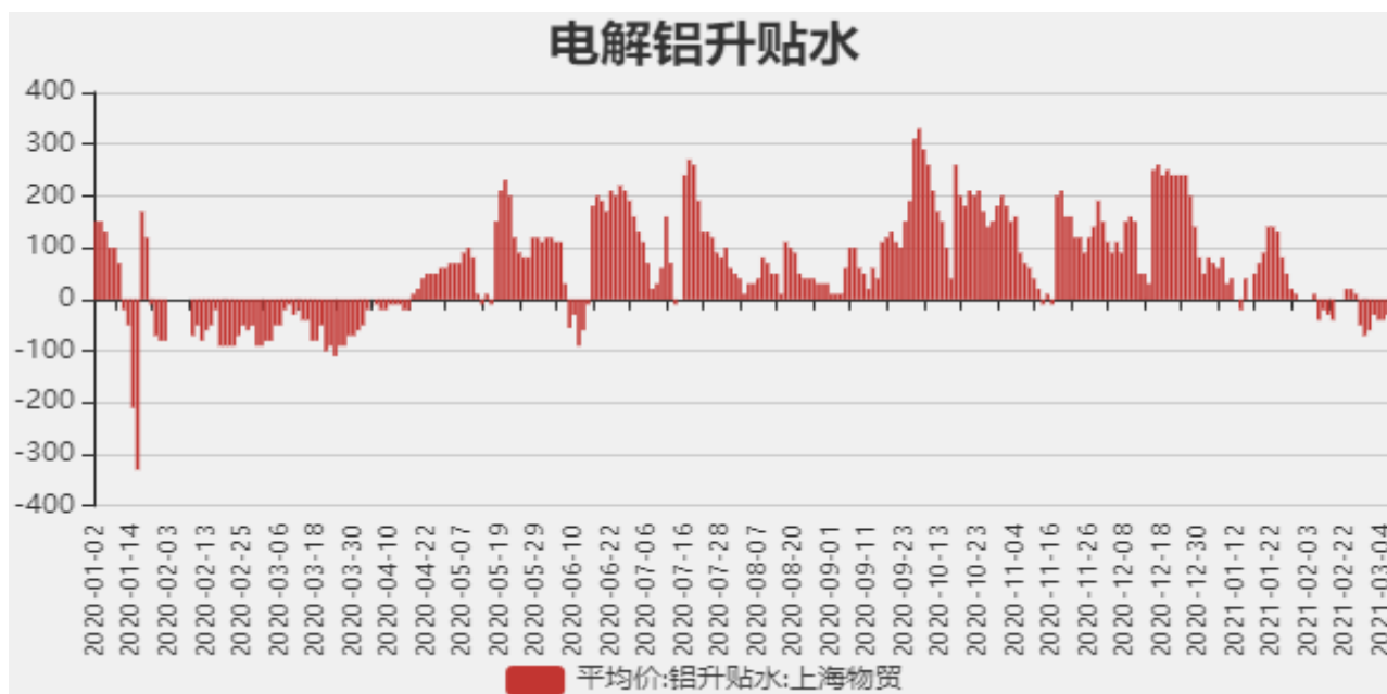
图2：电解铝升贴水走势图

截止至2021年2月26日，长江有色金属市场1#电解铝平均价为17245元/吨，沪铝期货价格为17100元/吨。