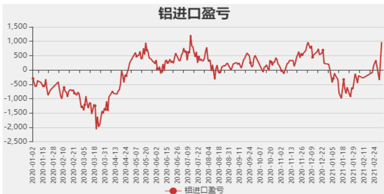
图5：铝进口利润和沪伦比值

截止至3月5日，贵阳氧化铝价格为2350元/吨；库存方面，截止至2月26日，国内总计库存为46.8万吨。