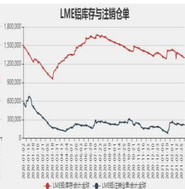
图9：LME铝库存与注销仓单比率

截止至2021年2月26日，上海期货交易所电解铝库存为334440吨。截止至2021年3月4日，LME铝库存为1299775吨，注销仓单为215975吨。