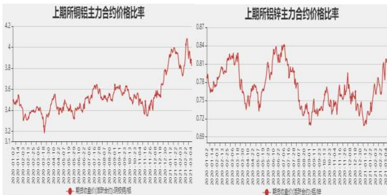
图14：沪铝与沪锌主力合约价格比率

截止至3月5日，铜铝以收盘价计算当前比价为3.8226，铝锌以收盘价计算当前比价为0.8119。