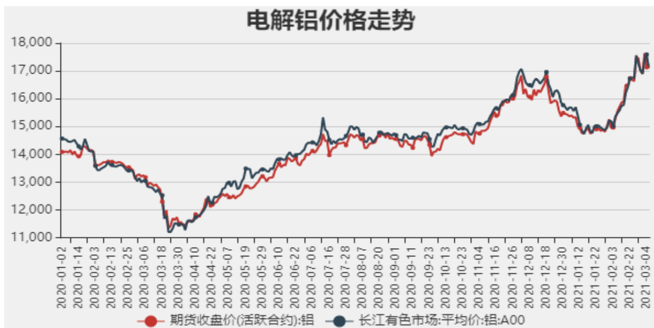
图1：电解铝期现价格

截止至2021年2月26日，长江有色金属市场1#电解铝平均价为17245元/吨，沪铝期货价格为17100元/吨。