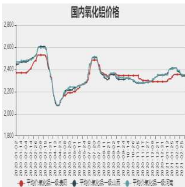
图3：国内氧化铝价格