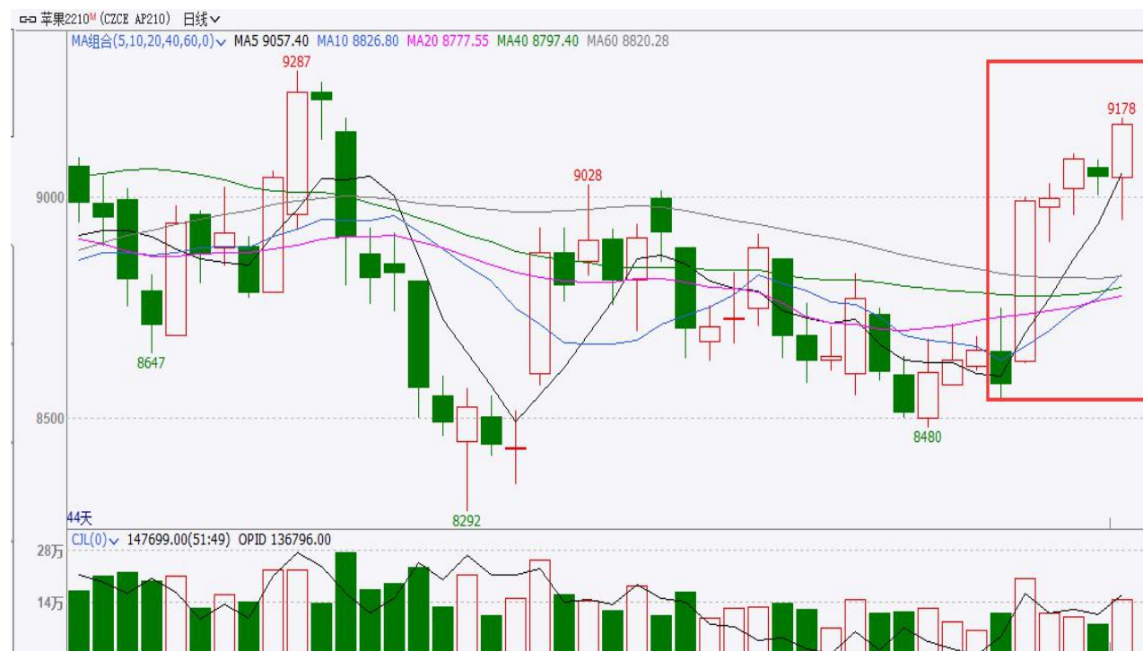
图、苹果主力2210合约价格走势