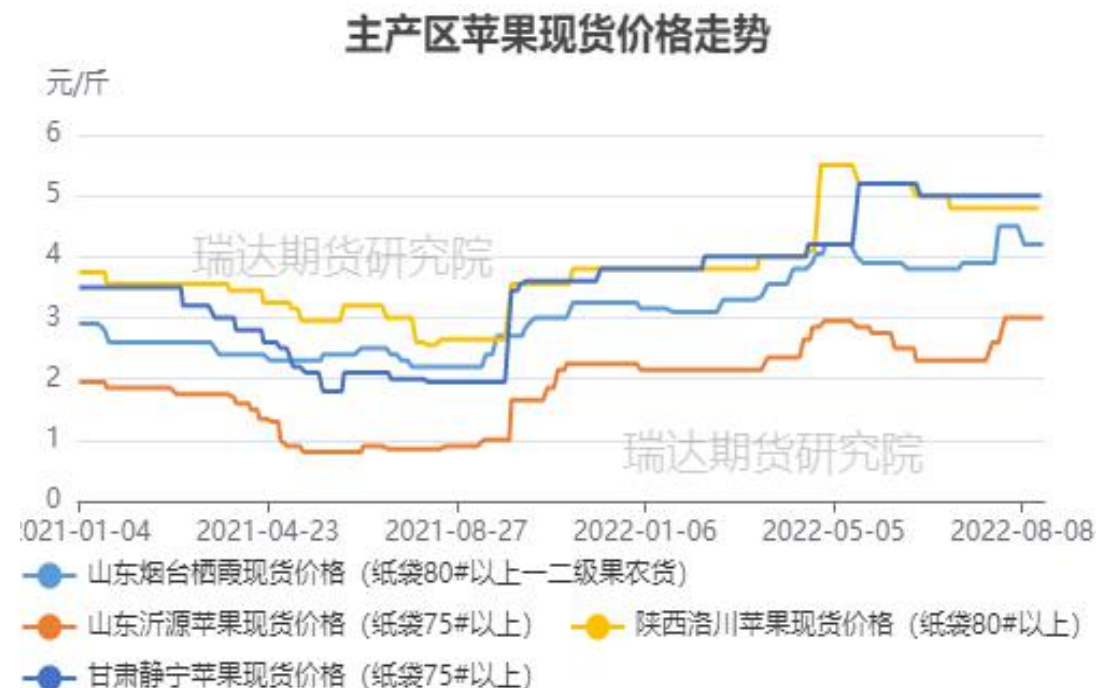
图、主产区苹果现货价格走势