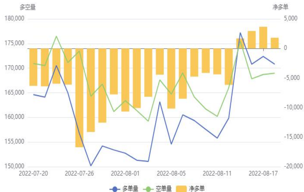
苹果(AP)前20持仓量变化