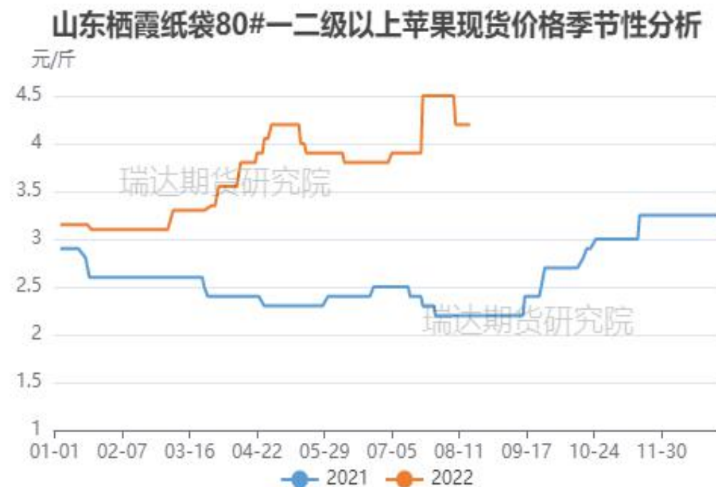
图、山东栖霞80#一二级苹果现货价格季节性走势