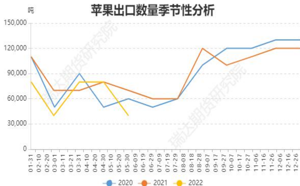
图、苹果出口量季节性情况