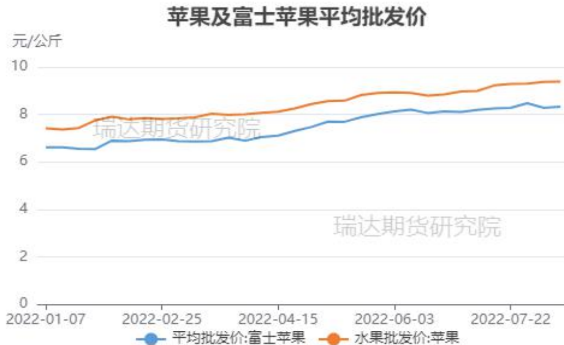
图、全品种苹果及富士苹果批发价格