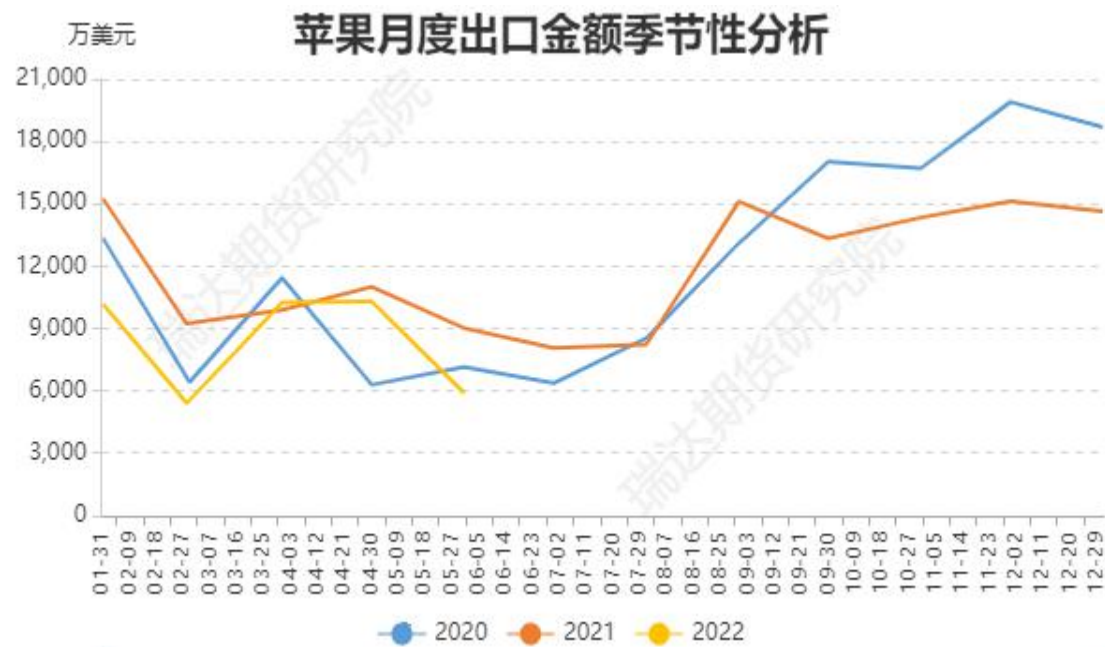
图、苹果出口金额季节性走势