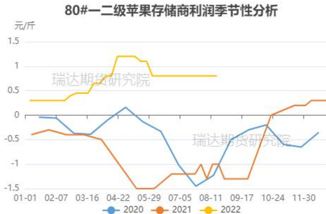
图、80#一二级富士存储商利润走势